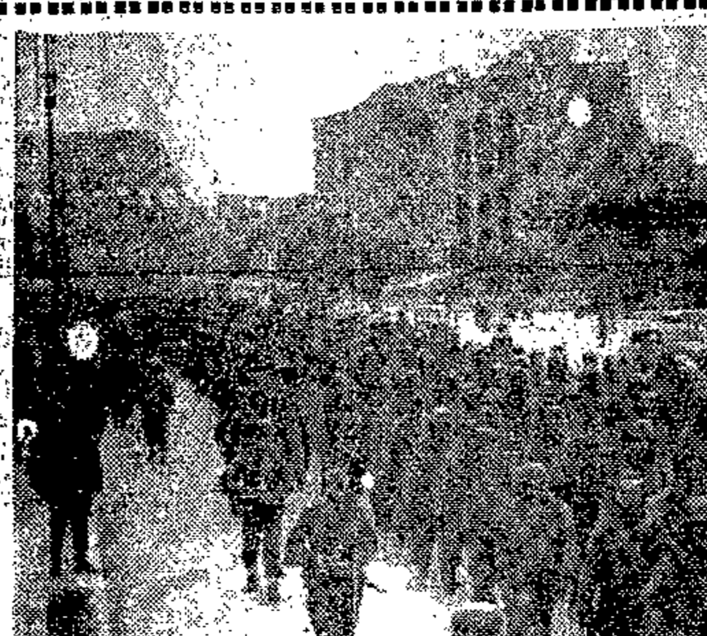
Il Maresciallo Graziani ispeziona i fanti a Vercelli