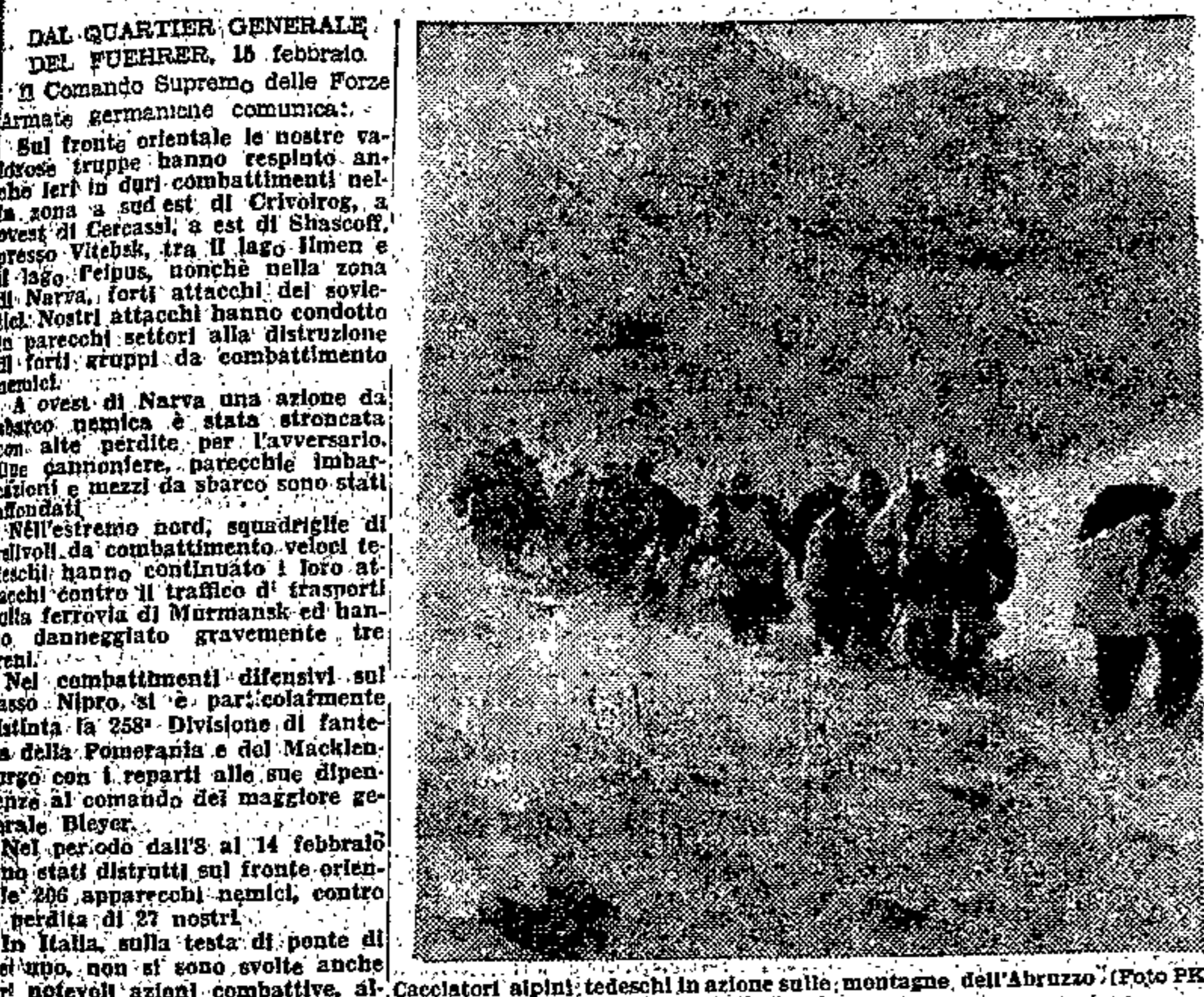
Cacciatori alpini tedeschi in azione sulle montagne dell'Abruzzo