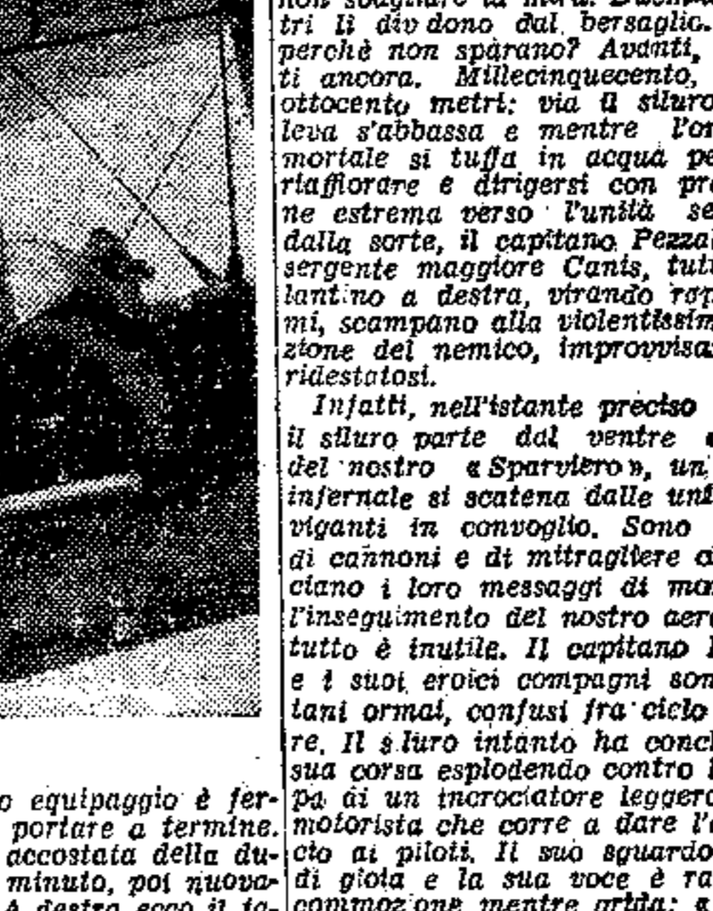
Il capitano Umberto Pezzali

Come il capitano Umberto Pezzali in una notte di luna in mezzo al fragore ed ai bagliori della battaglia colpì e affondò un incrociatore nemico