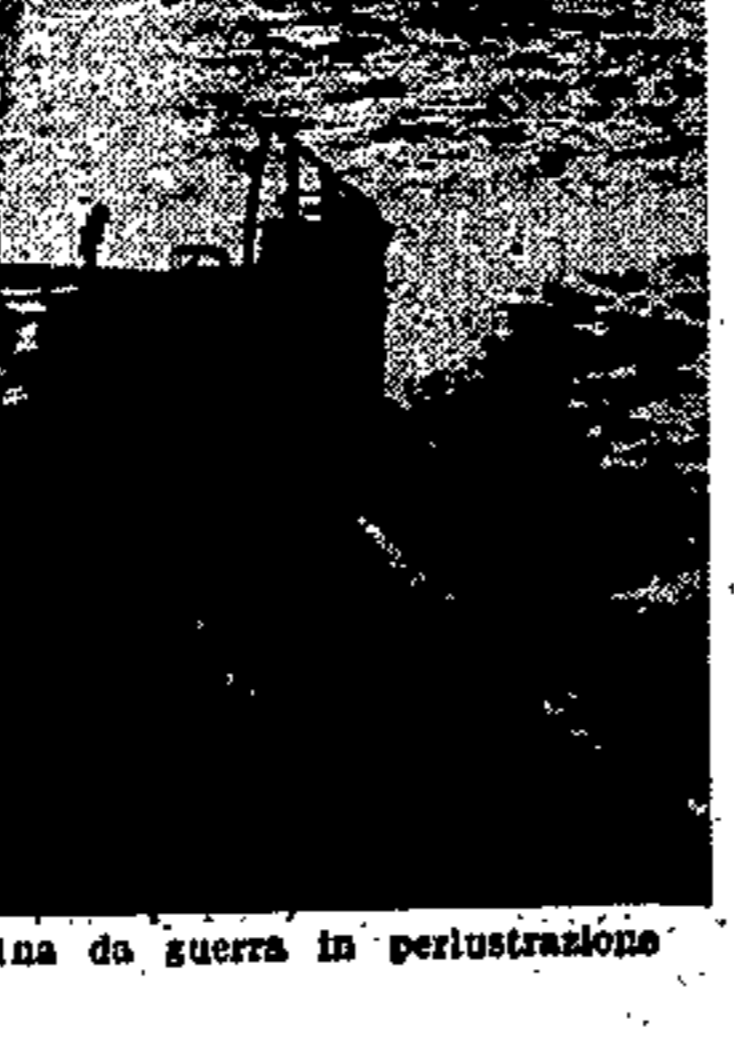
Nezri leggeri della nostra Marina da guerra in perlustrazione

UNA DONNA PRONTA A TUTTO. Troppo tardi è la guerra di prima disciplina. Trent'anni dopo - disciplina, sono i titoli di 5 brillanti illustrazioni colorate di Elio Pavesi nel n. 29 di «Il Travaso». Questo speciale fascicolo del più diffuso settimanale satirico, al quale collaborano disegnatori e scrittori di grande notorietà, è anche ricco di altre numerose illustrazioni in nero e a colori e di scritti arguti e spiritosi.