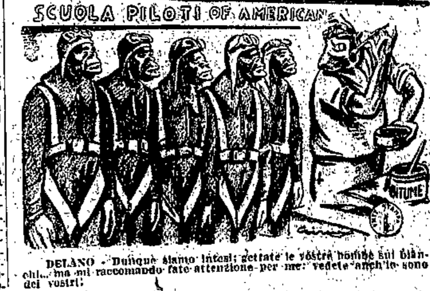
SCUOLA PILOTI OF AMERICANS

ROMA, 12. La settimana che oggi si conclude è caratterizzata da un'attività pressante aerea nei riguardi della battaglia di Pantelleria. La Commissione di Finanza del Senato ha esaminato e approvato alcuni disegni di legge.