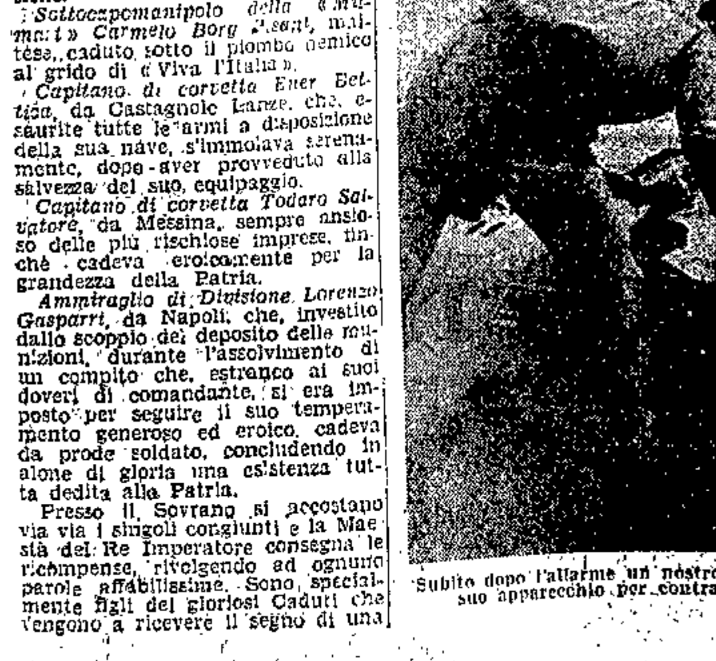
Subito dopo l'attimo un nostro cacciatore è pronto a bordo del suo apparecchio per contrastare al nemico di cielo italiano.

Il tempo in cui il Professor Salvemini predicava la necessità di un governo democratico, il nostro destino è a tal punto idealmente consegnato (materialmente aiutato dal Governo) all'erede del nostro secolo, che la costa orientale dell'Italia è perduta.