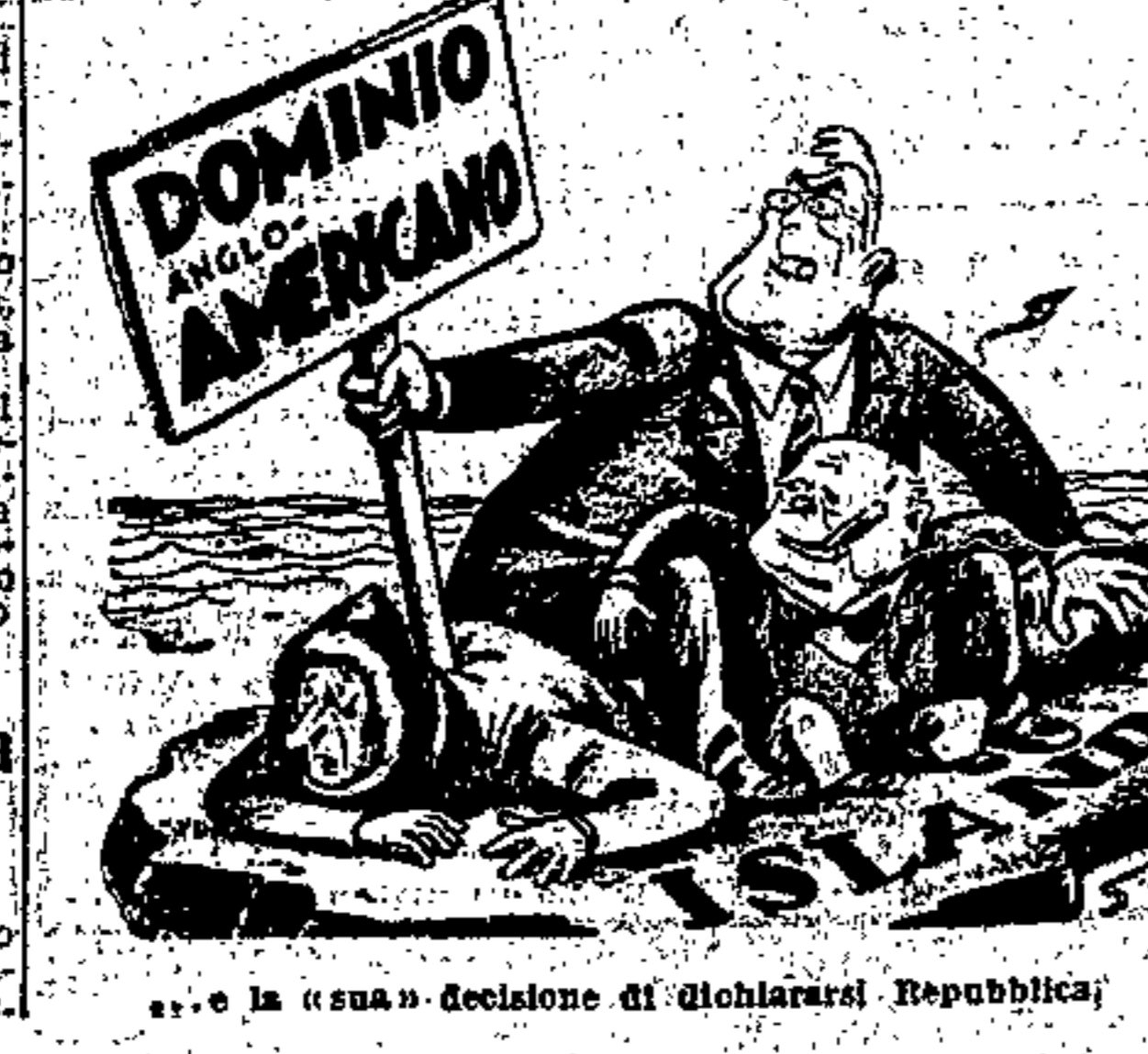
«La nuova» decisione di dichiararsi Repubblica

ROMA, 15. - I giornali di Londra pubblicano del riassunto del libro pubblicato da Wilkie dopo il suo viaggio in Russia, il capo del repubblicanesimo americano, che non si dubbia che i sovietici nella loro opera di costruzione della Russia abbiano compiuto numerosi delitti.