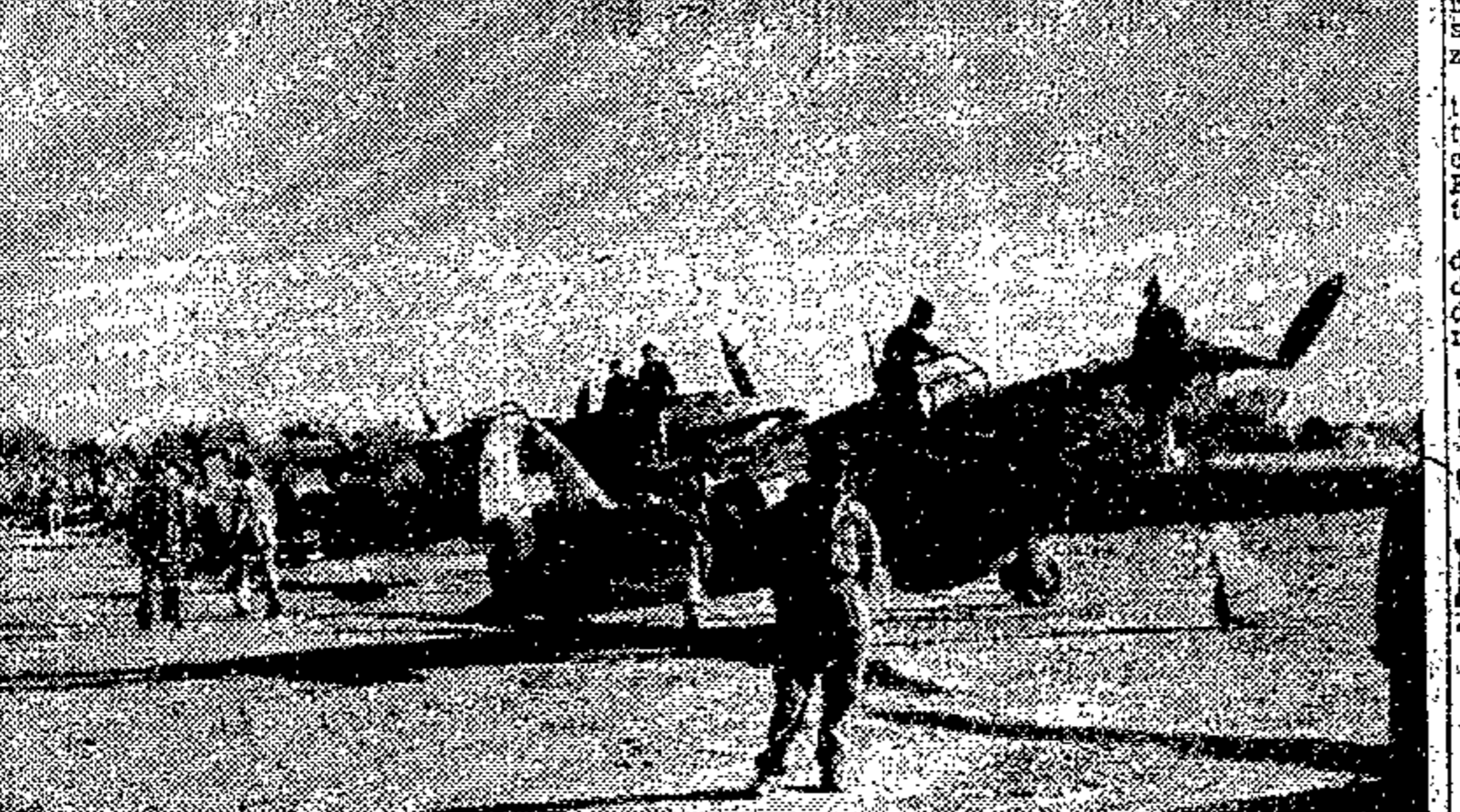
Formazioni di apparecchi da caccia italiani pronti per decollare da una nostra base aerea in Tunisia.

La legge sul servizio nazionale conferirebbe a Roosevelt poteri illimitati per l'utilizzazione del potenziale umano.