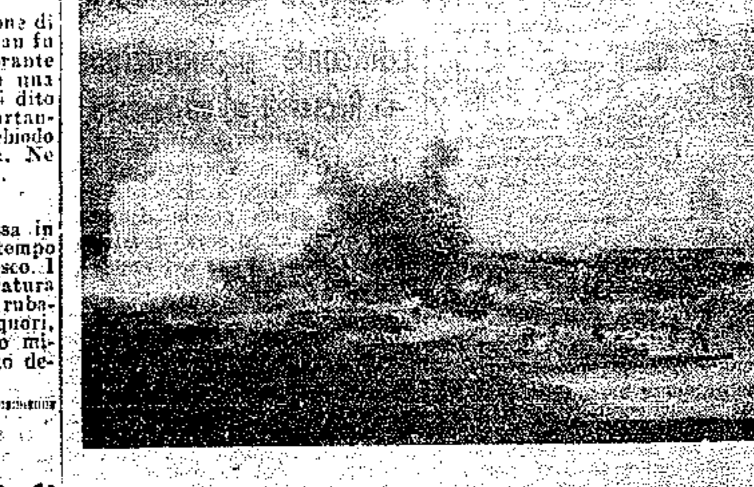
Poderosa unità della Marina da guerra germanica in navigazione in un fiordo norvegese