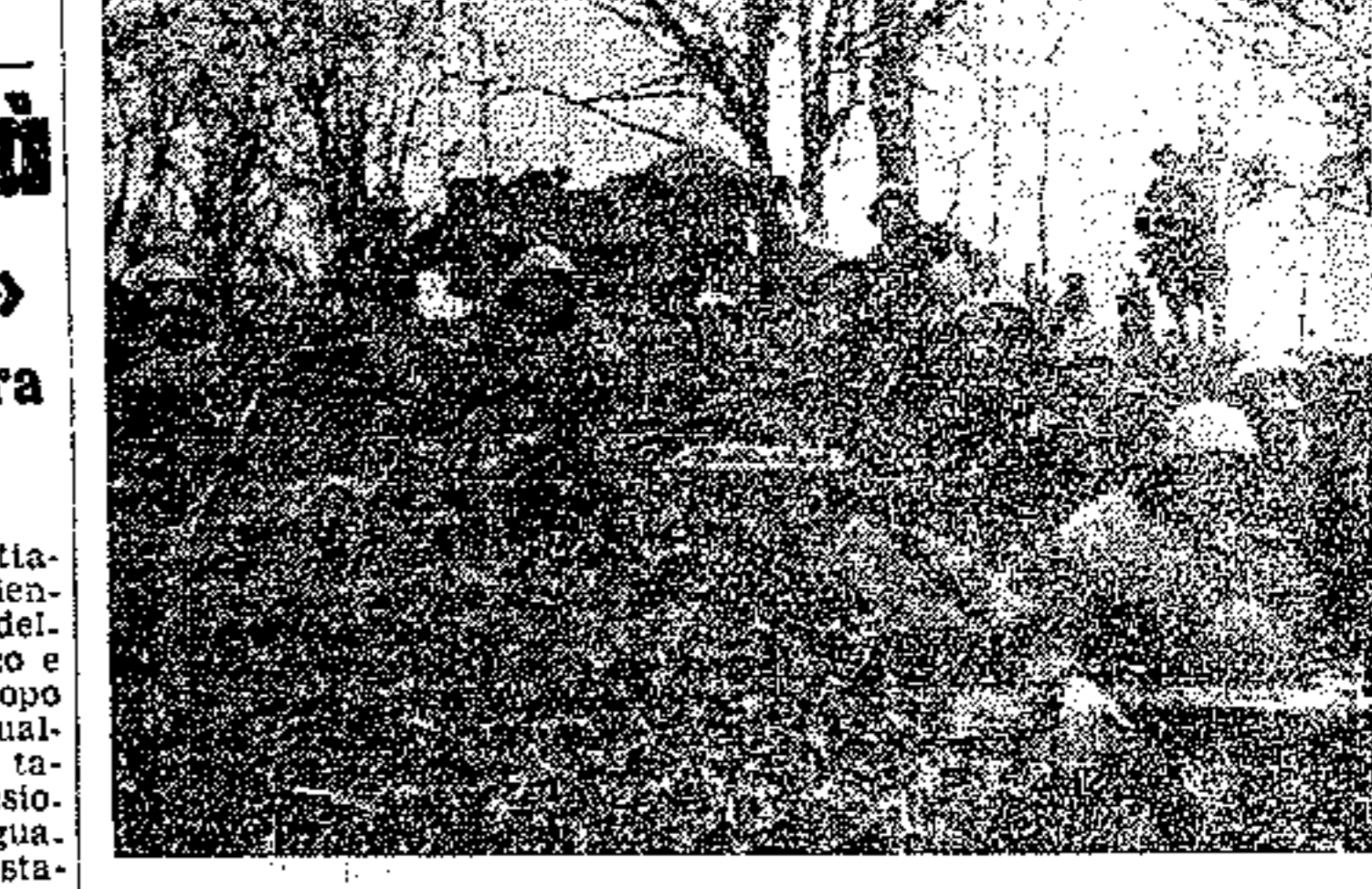
Truppe romane, protette contro la vista del nemico da un bosco del Caucaso, attendono il momento di scattare all'attacco