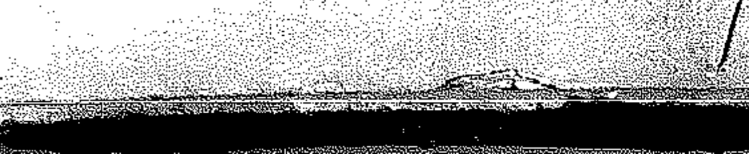
Nave da battaglia germanica vista dal cassero di un incrociatore tedesco