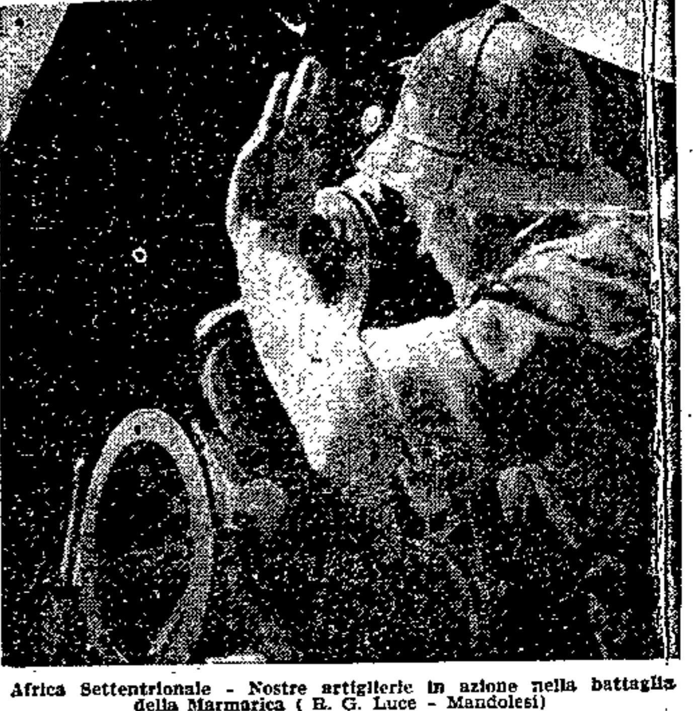
Africa Settentrionale - Nostre artiglierie in azione nella battaglia della Marmarica

Il rapporto dei presidenti e dei segretari provinciali dell'Istituto di cultura fascista.