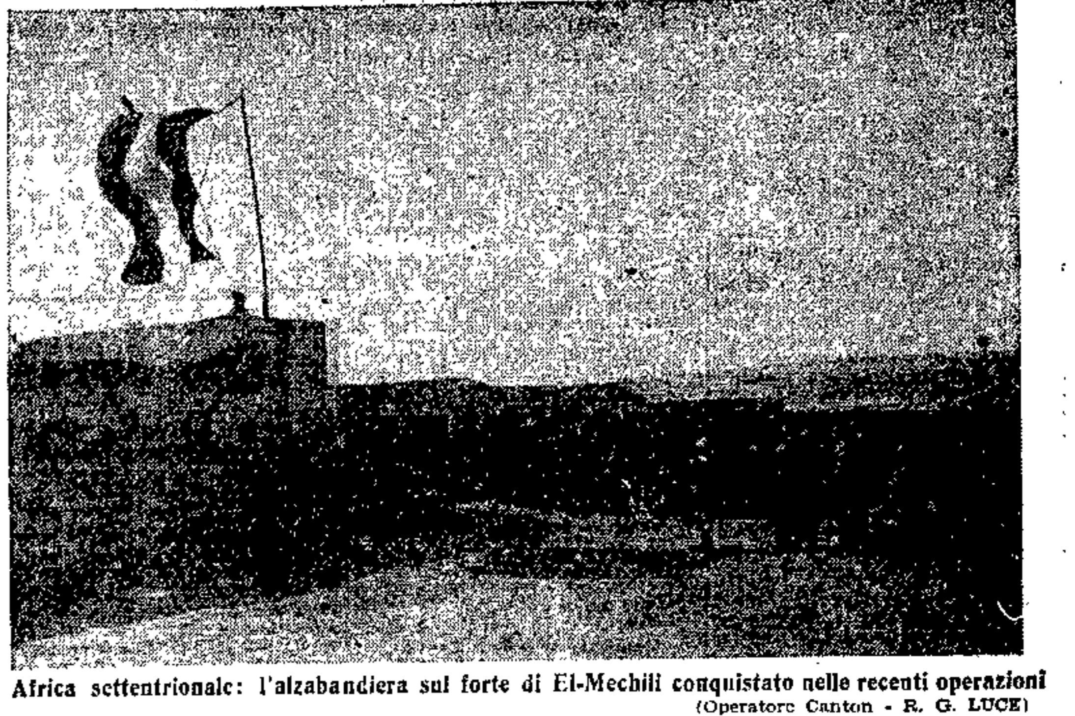
Africa settentrionale: l'alzabandiera sul forte di El-Mechili conquistato nelle recenti operazioni

La gravità delle perdite navali ROMA, 6. La gravità delle perdite navali che il nostro paese ha subite durante l'occupazione di Batavia, è stata celebrata dal capellano maggiore del dipartimento marittimo dell'Alto Adriatico, il cardinale Piazza ha fatto un commosso elogio funebre dell'augusto scomparso, ricordando la sua vita e l'opera, dall'adolescenza alle memorabili giornate dell'Arba Alagi, del glorioso Principe Sabauda. L'iniziativa consacrerà alla meditazione ed alla riconoscenza degli italiani ed in particolare modo dei colonialisti. L'opera dell'eroico Duca che ha vissuta tutta intera la passione africana della nuova Italia, dalla riconquista del Fezzan alle opere della colonizzazione etiopica nella quale Egli portò la Sua ardente fede di pioniere, di africano, di credente nelle fortune di un'Africa redenta e civilizzata.