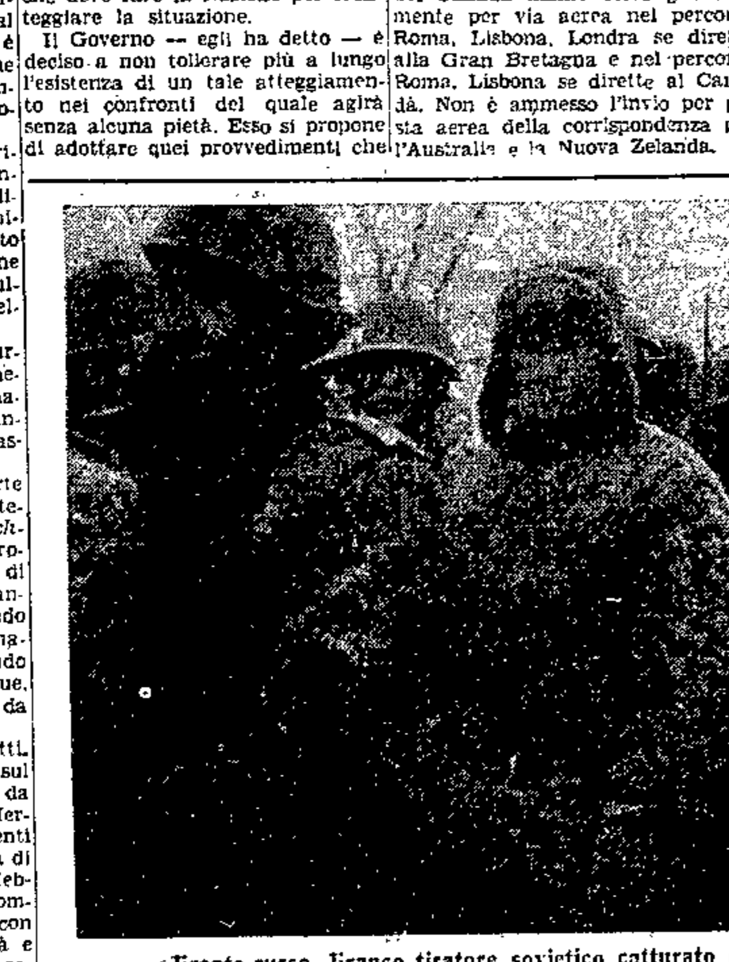
Fronte russo. Franco tiratore sovietico catturato da un nostro reparto