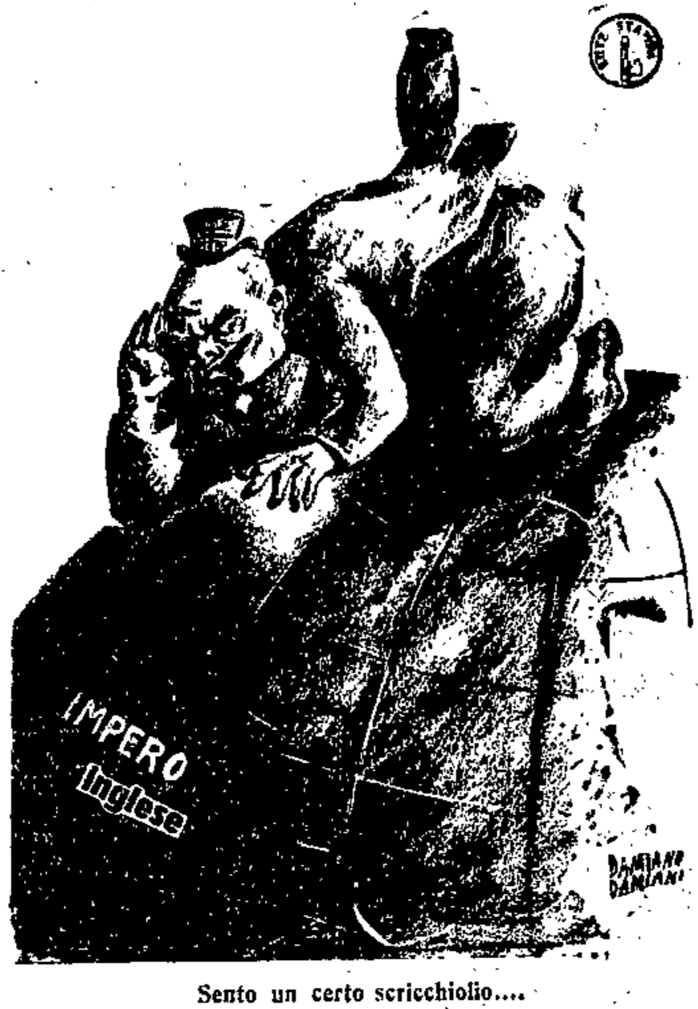
Sento un certo scricchiolio...

possono essere ritenuti necessari per impedire ogni abuso da parte di un gruppo di egotisti i quali, malgrado le gravi difficoltà dell'ora, credono di potere svolgere i loro affari come al solito e godere delle solite comodità. Occorre — egli ha aggiunto — che vengano eliminate tutte le stravaganze personali e che venga evitata qualsiasi forma di spreco, piccolo o grande che sia, per qualsiasi spesa non necessaria. Nell'interesse dello sforzo bellico e chiamata tutta la Nazione, non è possibile tollerare che chiunque possa ostacolare l'efficienza o la rapidità della produzione. Noi dobbiamo perciò — ha concluso Cripps — tenere a freno ogni accanimento del nostro sforzo bellico in ogni modo e con qualsiasi mezzo.