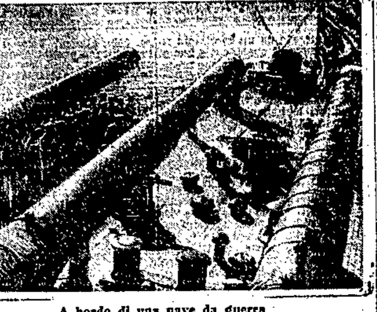
A bordo di una nave da guerra

Il Duce ha ricevuto il generale Ambrosio comandante della II Armata dislocata oltre Adriatico. Il generale gli ha fatto un rapporto sulla situazione e gli ha consegnato la situazione delle truppe poste sotto il suo comando.