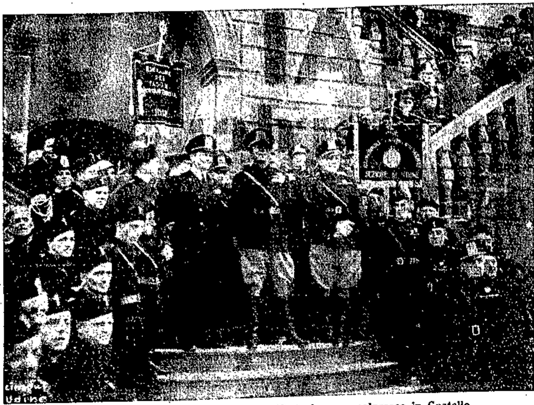
Il Ministro assiste alla manifestazione popolare in Castello

rica come si conviene tra uomini che nella e per la scuola vivono. Il Ministro ha proseguito il suo discorso esaltando la missione educativa che la scuola ha verso i giovani, missione che deve essere intesa nel senso nuovo, nel senso voluto dal clima in cui oggi tutti gli italiani vivono.