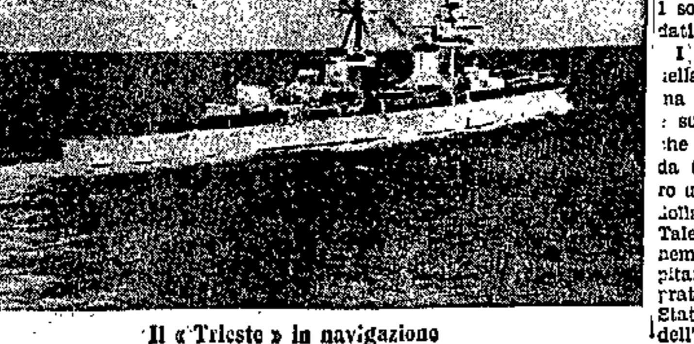
Il «Tilisto» in navigazione

Questo complesso d'incalce forma attualmente la flotta italiana. Potrebbe si è detto di recente che nulla sarà trascurato per potenziare ancora l'efficacia delle forze armate, non è detto che il quadro che abbiamo dato non sia già discosto dal vero. Comunque riassumiamo: Navi da linea 8 Incrociatori A 8 Incrociatori B 14 Navi leggere 159 Sommergibili (classe) 125 Questa è la Marina del Littorio. Sul mare — come altrove — i destini della Patria sono sicuri.