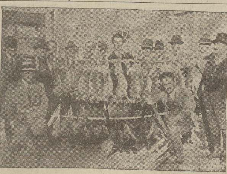
Il risultato di 3 ore di caccia nella riserva di Porcia