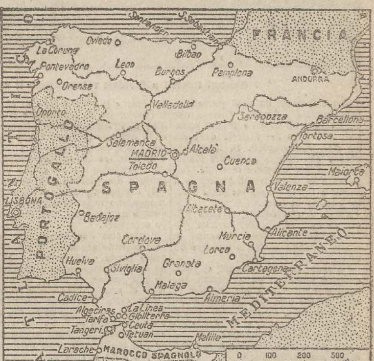
Map showing the location of Santander and other cities in Spain.

Il saluto del Duce e di Roma ai trionfatori della gara aerea. Il saluto del Duce e di Roma ai trionfatori della gara aerea.