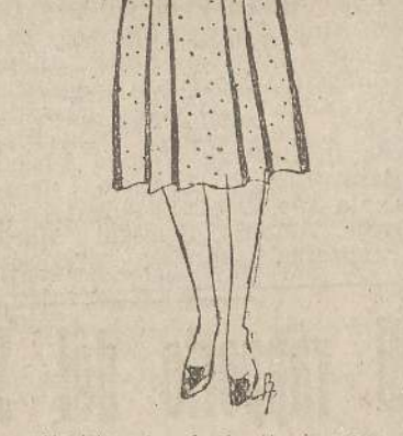
Vestito per giovinetta in canapa lizzata bianca con puntini rosso vivo; gli smerli e la cintura sono in seta bianca.

Se invece la linea dell'abito sarà diritta, nella, inguainante, si sceglierà una Pettinatura semplice, sopprimendo anche i riccioli sulla nuca per non guastare la linea pura del collo. Quelle con i capelli tutti rialzati in modo