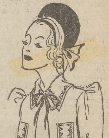
Giacca serotta ad aureola per giovinetta in crine blu corvo con fascia in taffetà fruscante bianco-avorio.

Manzo all'altito. - Fate dorare nel burro del forno tagliato a dadi, cospargete di farina e mescolate. Aggungete un mestolo di brodo, sale e pepe, prezzemolo, sedano, cipolla tritata, carota e qualche patata e una rapa tagliata a fette. Di lì a poco metteteci anche il manzo e lasciate stufare adagio. Quando la verdura è cotta acciocate la carne in un piatto, circondatela della verdura eirroratela col sugo.