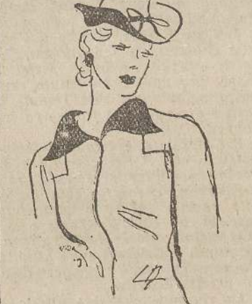
Cappellino molto elegante per montagna in pectico greggio con sott'ala in pectico azzurro.

Le incertezze delle Pettinature e le loro variazioni infinite, soprattutto per sera e con abiti interessanti per la linea, ha fatto rinascere l'amore agli ornamenti posati sui capelli. E' per questo che sono nati i fiori, le piume, le piccole stelle di strasse, e la personalissima acconciatura fatta di una treccia posticcia in capelli ed in tessuto uguale alla veste atorcigliati insieme.