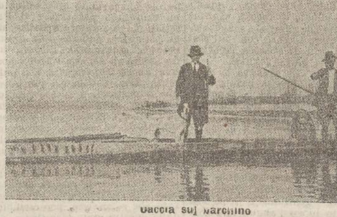
Uccello sul mare

Quanto si è detto vale anche per le specie di passo per cui la caccia primaverile dovrebbe essere definitivamente abolita. Ed è una giustificazione assai magra quella che si possono uccidere senza danno gli