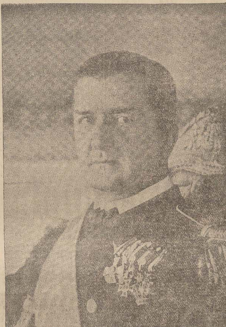
S. A. S. Serenissima l'ammiraglio Nicola Horthy

Data da allora quella politica di accerchiamento con la quale si avrebbe voluto assoggettare un popolo, a cui era stato strappato il 70 per cento del territorio e il 60 per cento della popolazione, per poterlo grandire smisuratamente altri Stati.