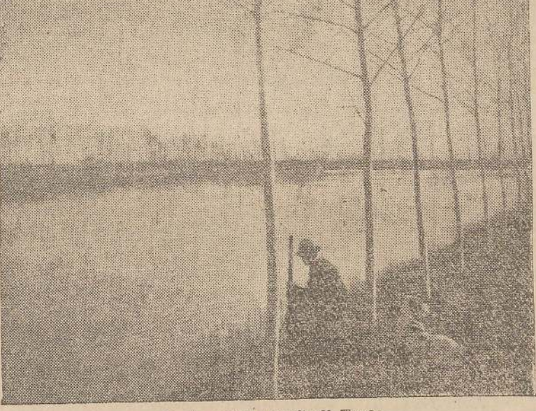
Sosta nella palude di Torsa

Tempi nuovi, vita nuova. Ma la doppietta vuole ancora le sue suddivisioni, e le vogliono anche i cani, per Dio, queste bestie umane che mal soffrirebbero a starsele nelle giornate inerte. Ma niente di male: si muta la selvaggina, ecco tutto. Dalla migratoria si passava alla stanziale: lepri, starni sar-