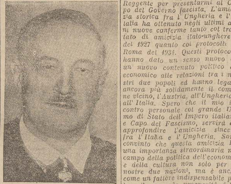
Il Presidente del Consiglio Ungherese Colomanno di Daranyi

BUDAPEST, 23. S. A. S. il Reggente di Ungheria e la consorte sono partiti per l'Italia. Su tutto il lungo percorso dal palazzo reale di Budapest sino alla stazione ferroviaria dell'est una folla fittissima ha acclamato il Capo dello Stato con