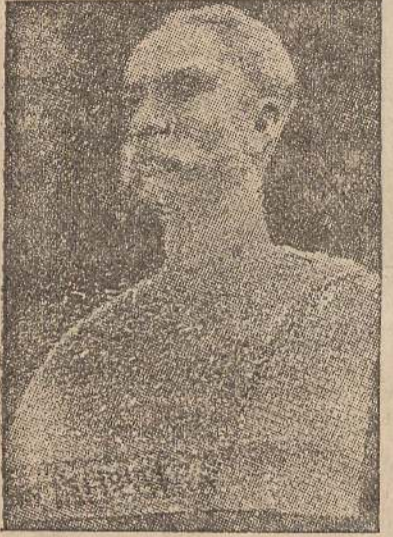
Il busto dedicato da Udine al gen. Baldissera