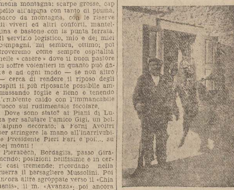
Il Presidente « Pieri Fari » con la preta di Eopj Romanin

to del cacciatore venne documentata di piccola mole e cinque lepri. Per quanto riguarda l'anare delle diughe lepri sembra che ci sia di mezzo un equivoco. A forza di raccomandarsi a più di un collega, le lepri degli altri raggiunsero il domicilio dell'amico. Ora però sono mangiate e in quanto al prezzo di costo ci metteremo sempre d'accordo. Fra colleghi... Vorrei raccontare quella successa a Mecchia e alla sua pipa, ma lo raro un'altra volta — se lo farò — perché vedo che i miei racconti minacciano lo spazio del giornale.