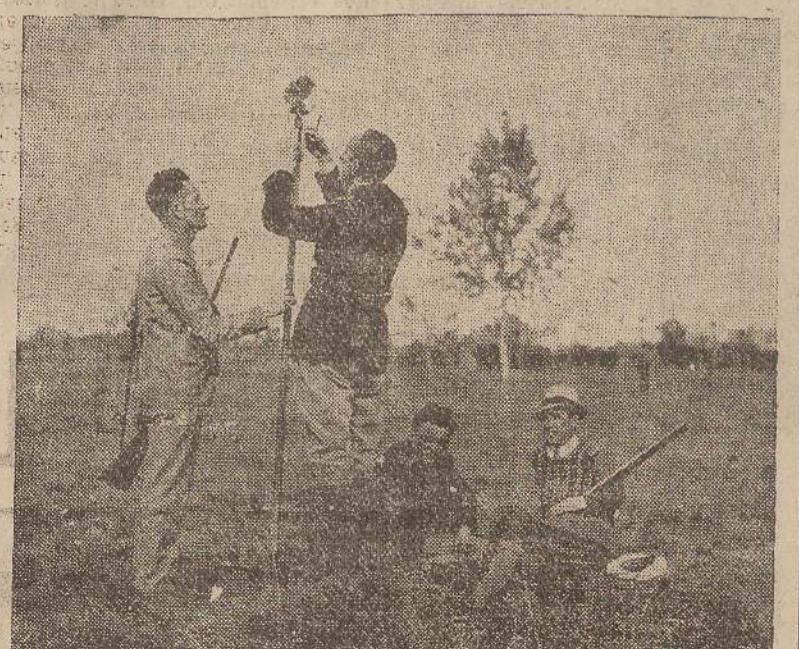
Si « inalbera » la civetta

La caccia ai valichi porge al cacciatore momenti di schietta felicità.