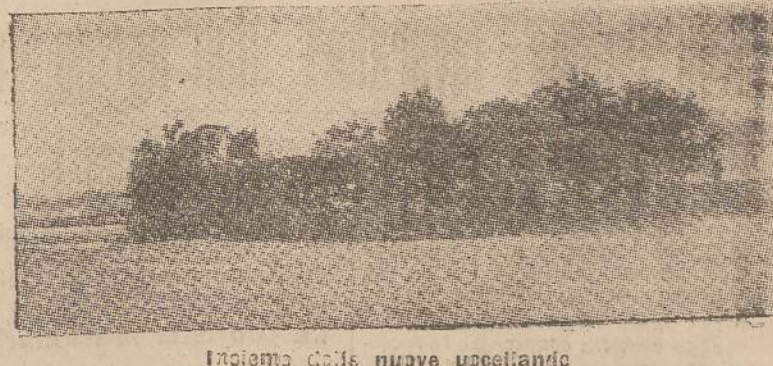
Indicami della nuova uccellando

Interessante notiziario e cronaca provinciale