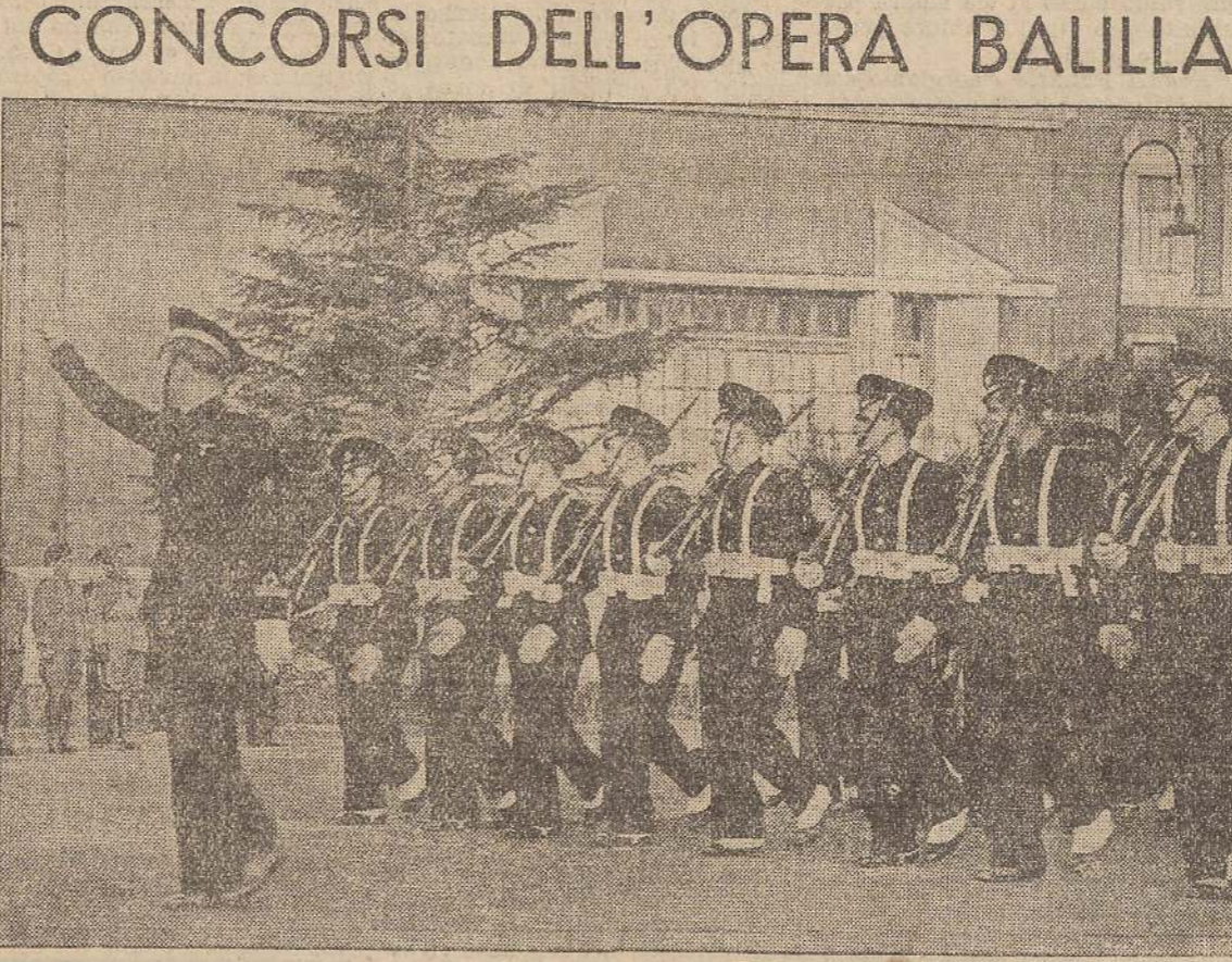
500 posti all'Accademia Fascista di Educazione Fisica - Foro Mussolini - Roma 200 posti all'Accademia Fascista Femmine di Educazione Fisica - Orvieto 40 posti all'Accademia Fascista di Scherma - Foro Mussolini - Roma.

La Istituzione del Regime sa cogliere ed apprezzare, ogni anno maggiormente, lo spirito che ne informa l'azione, la bellezza che la illumina e l'ideale che la santifica.