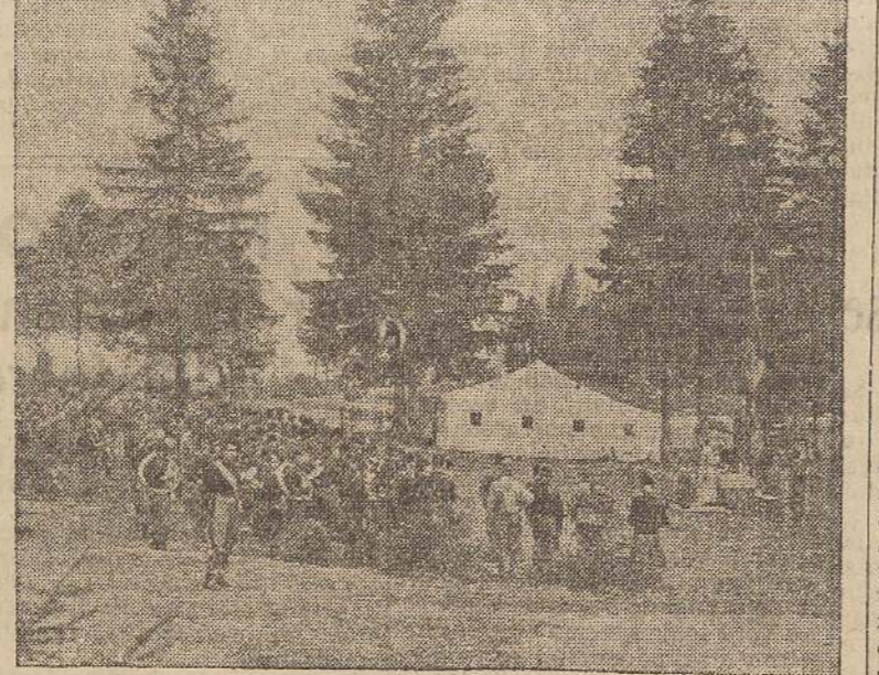
Messa al Campo nell'abetata.