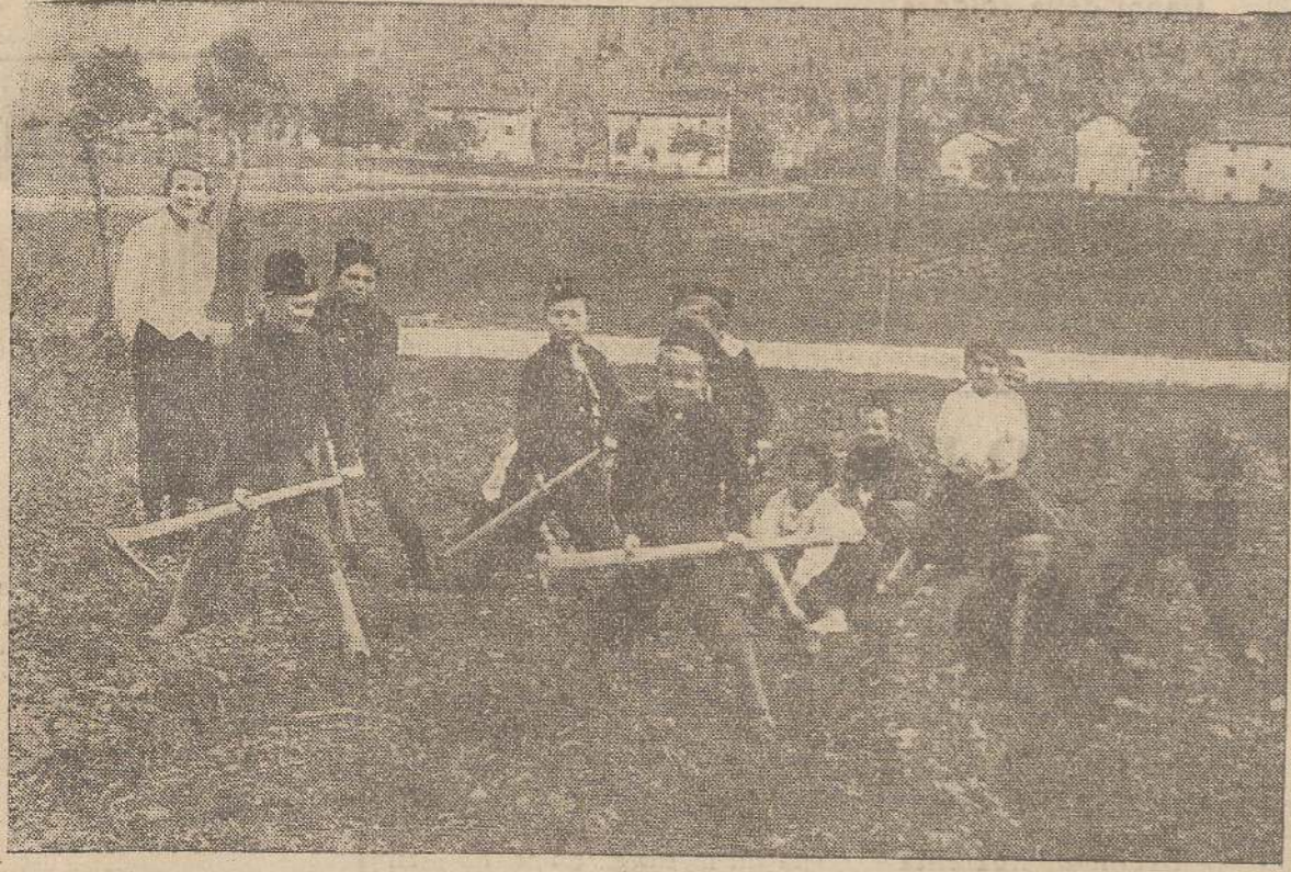
I piccoli rurali alla presa con il campicchio attiguo alla Scuola.