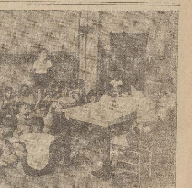
Lezioni teoriche per gli Avanguardisti che partecipano al prossimo Concorso «Dux». Come è noto, sia nell'interno della palestra, come nel cortile della Casa del Balilla, hanno svolgimento gli allenamenti per i «daxisti» dell'Anno XIV.