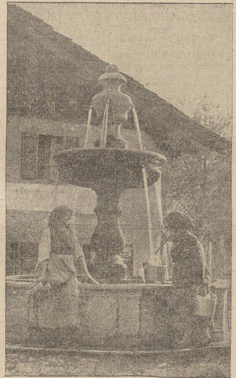
Chigochiere mattutine alla fontana del paese

Ed eccomi anche quest'anno a godermi un po' di fresco in questa Carnia tanto bella ma non altrettanto conosciuta e apprezzata dal gran pubblico italiano. Eppure, per chi vuole effettivamente riposare, togliersi dalle noie della città, rinunciando per un certo tempo agli obblighi della moda, lontani dai rumori, vivendo un po' con la natura, escludendo le finzioni protocolliari nelle passeggiate, calzando scarpe grosse oppure « scarpette » carnieli, godendo dei panorami immensi che si cambiano ad ogni svoltare di strada o sentiero, osservando la vita umile, dura, ma tranquilla dei montanari, tanto diversa da quella cittadina, fermandosi ogni qual tratto ad ascoltare i mistici canti d'amore o di dolore delle villette, sedendo