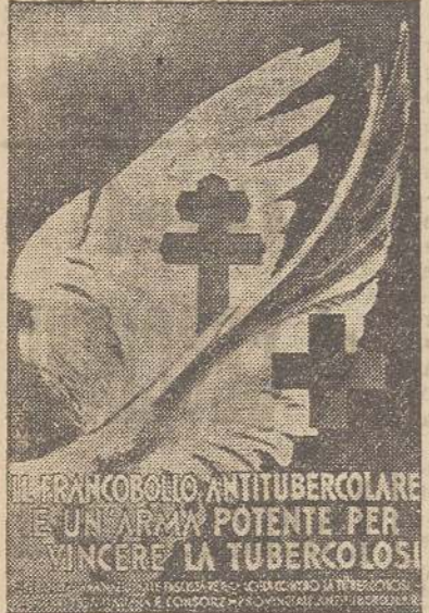
FRANCOSOLIO ANTITUBERCOLARE E UN'ARMA POTENTE PER VINCERE LA TUBERCOLOSI