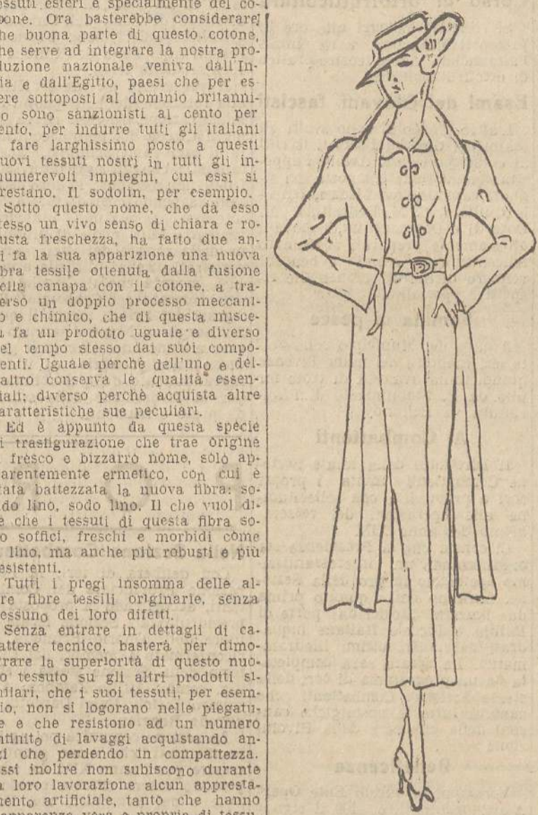
Elegante «insieme» con giacca «due terzi» in sodolin verde