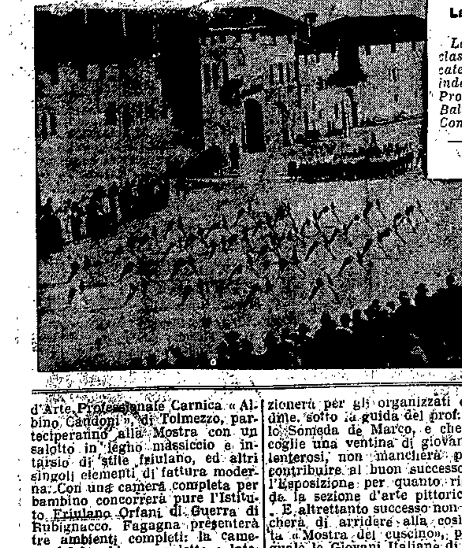
La festa ginnica di Bicinisco. La fotografia prima classificata nella quarta categoria del concorso indetto dal Comitato Provinciale dell'Opera Balilla fra i Comitati comunali.

In occasione della VII Festa Ginnastica dell'Opera Balilla, festa che non richiede un commento dopo che si siano osservati i dati riportati nello specchio a fianco ed a cui hanno partecipato in pieno tutti i Comitati Comunali della Provincia, la Presidenza Provinciale dell'Opera Balilla, ha avuto il piacere di indovinare un concorso fotografico fra Comitati Comunali per le migliori fotografie documentanti la Festa stessa. Dallo spoglio delle numerose fotografie pervenute al Comitato Provinciale la classifica del Concorso è risultata la seguente: I. Categoria (Nessun fotografato). La migliore fotografia prescelta: Tarcento. II. Categoria 1. classificato: Pozzuolo del Friuli; 2. classificato: Cervignano; 3. elogiato al Comitato di Talmassona. III. Categoria 1. classificato: Pontebba; 2. classificato: Bagnaria Arsa. IV. Categoria 1. classificato: Bicinisco (con particolare elogiato); 2. classificato: Chiopris Viscone.