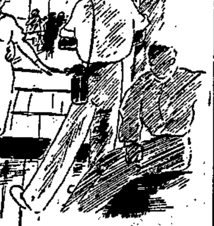
ci si fotografa accanto alla bimba

Qualche dopolavorista non regge alla tentazione di darsi delle arie esotiche, masticando il tedesco con la signorina del bar ed il francesco con quella dello spaccio di tabacchi. Ma il successo maggiore, invidiato da tutti, l'ottiene il nostro buon vigile le cui spalline d'oro e l'elmo a quota due metri fanno una impressione straordinaria sui marinai inglesi che lo credono un qualche grosso pezzo italiano e sui marinai italiani che se lo figurano rappresentante di chi sa quale potente