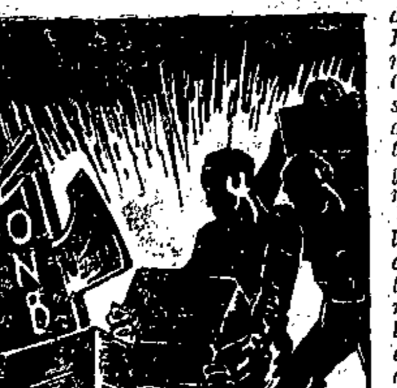
Il centro di sports non indifferente, capace, per i suoi impianti moderni e per la sua proporzionata attrezzatura, di gareggiare con i centri sportivi della maggiori città d'Italia.

Il sorgere del Collegio dell'O. N. B., il primo in Italia, segnerà dunque per Udine, un primato, ed una nuova prova della fecondità e realizzatrice attività svolta da chi è preparato alla direzione dell'organizzazione giovanile. Oltre a risolvere problemi a carattere prettamente magistrale per cui si ammirano progressivamente la costruzione dell'edificio maschile nelle classi magistrali, tale costruzione tiene a premiare gli sforzi di coloro che in certo qual modo hanno voluto istituire oltre ad un collegio, un