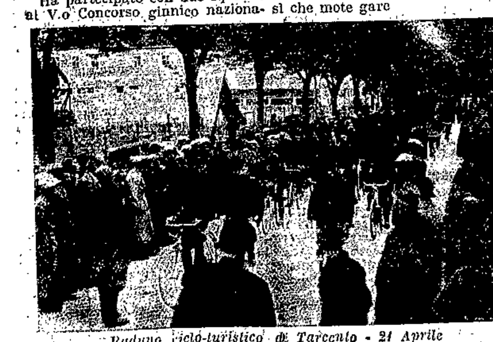
Raduno ciclo-turistico di Tarcento - 21 Aprile

ra, con tutte le istituzioni del Regime. Nella dimen- teato che molti dopolavoro organizzano la Betanna fascista, men- tre altri collaborano con altre istituzioni, per questa bella festa dei bambini. Fanno parte della assistenza le numerose ed importanti iniziative, che lavoratori ottengono con tale manifestazioni n. 2792.