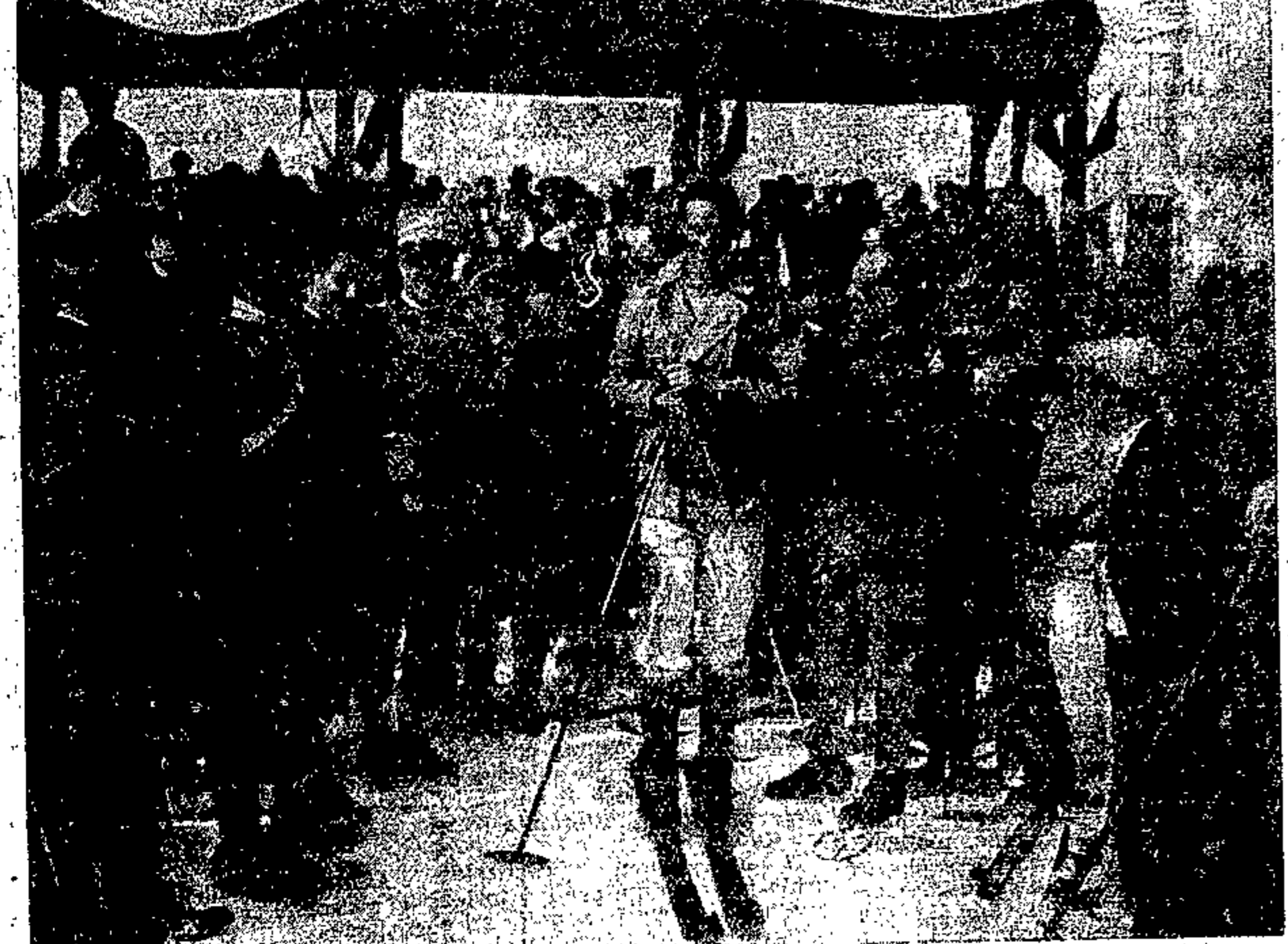
S. A. R. il Duca d'Aosta a Tarvisio in occasione del Raduno Triveneto per sciatori

Manifestazioni ricreative Queste manifestazioni che rientrano pure nel vasto quadro della attività dopolavoristica e che hanno la loro non dubbia importanza, hanno assunto un largo sviluppo. Sono manifestazioni che non si limitano soltanto alla festa da ballo familiare nella sede del Dopolavoro, ma si estendono ad iniziative diverse, gioiose e sane. Citiamo le numerose feste campestri che sono state organizzate quest'anno da molte sezioni dopolavoro con giochi e gare sportive, canti e balli all'aperto. Tali manifestazioni vengono indette in ogni centro, specialmente per il 21 aprile, in occasione della festa del lavoro. In alcuni centri, come a Remanzacco, Gemona, Orsaria, il dopolavoro si è fatto anche promotore delle manifestazioni carnevalesche a beneficio delle istituzioni paesane.