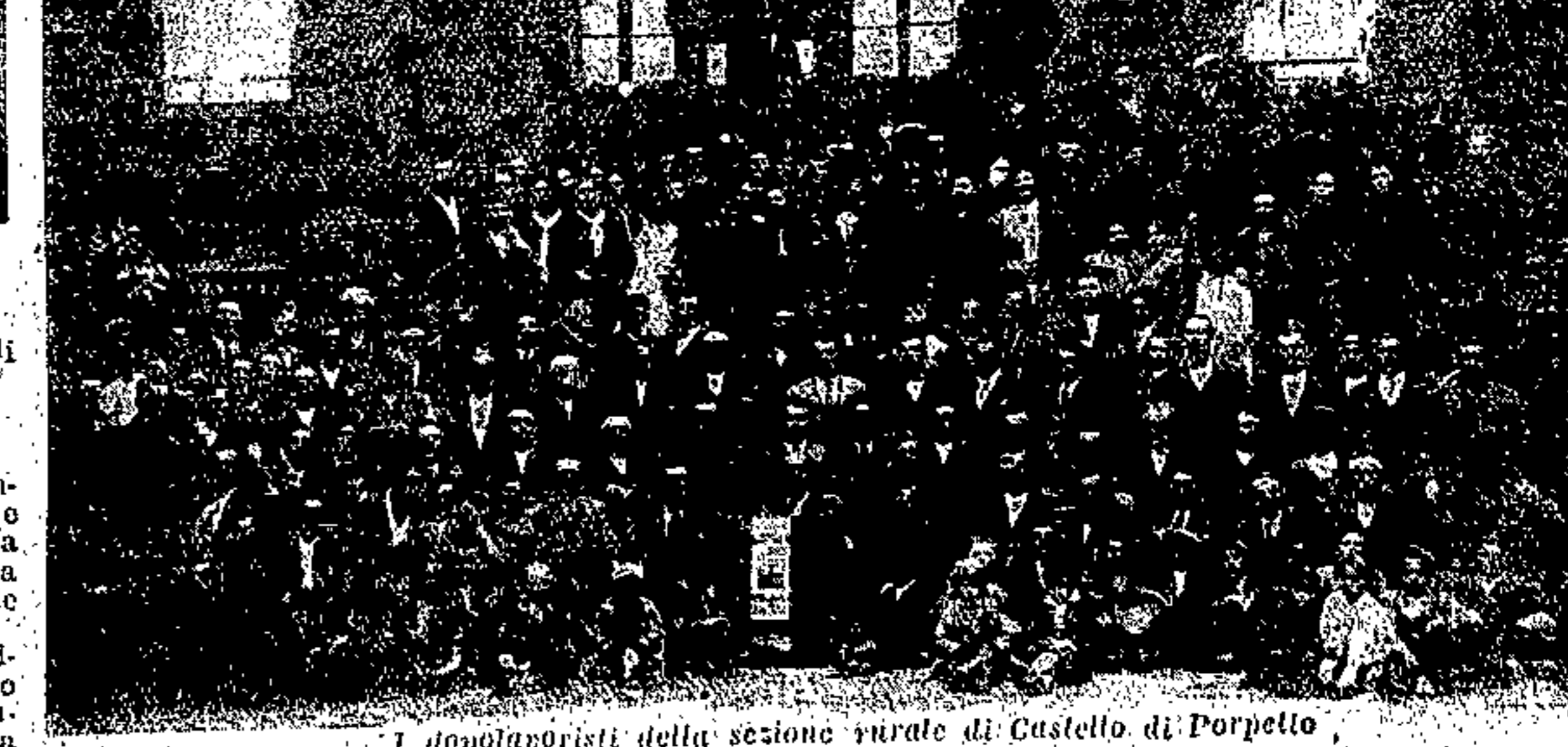
I dopolavoristi della sezione rurale di Castello di Porpetto

Questa attività, che tanta importanza ha per la ricreazione o l'educazione del popolo, è stata oggetto di particolare cura da parte del Dopolavoro Provinciale e delle sezioni dipendenti. La Federazione Filodrammatica ha raggiunto, come abbiamo visto, un totale di quasi cinquantatà gruppi che impegnano circa