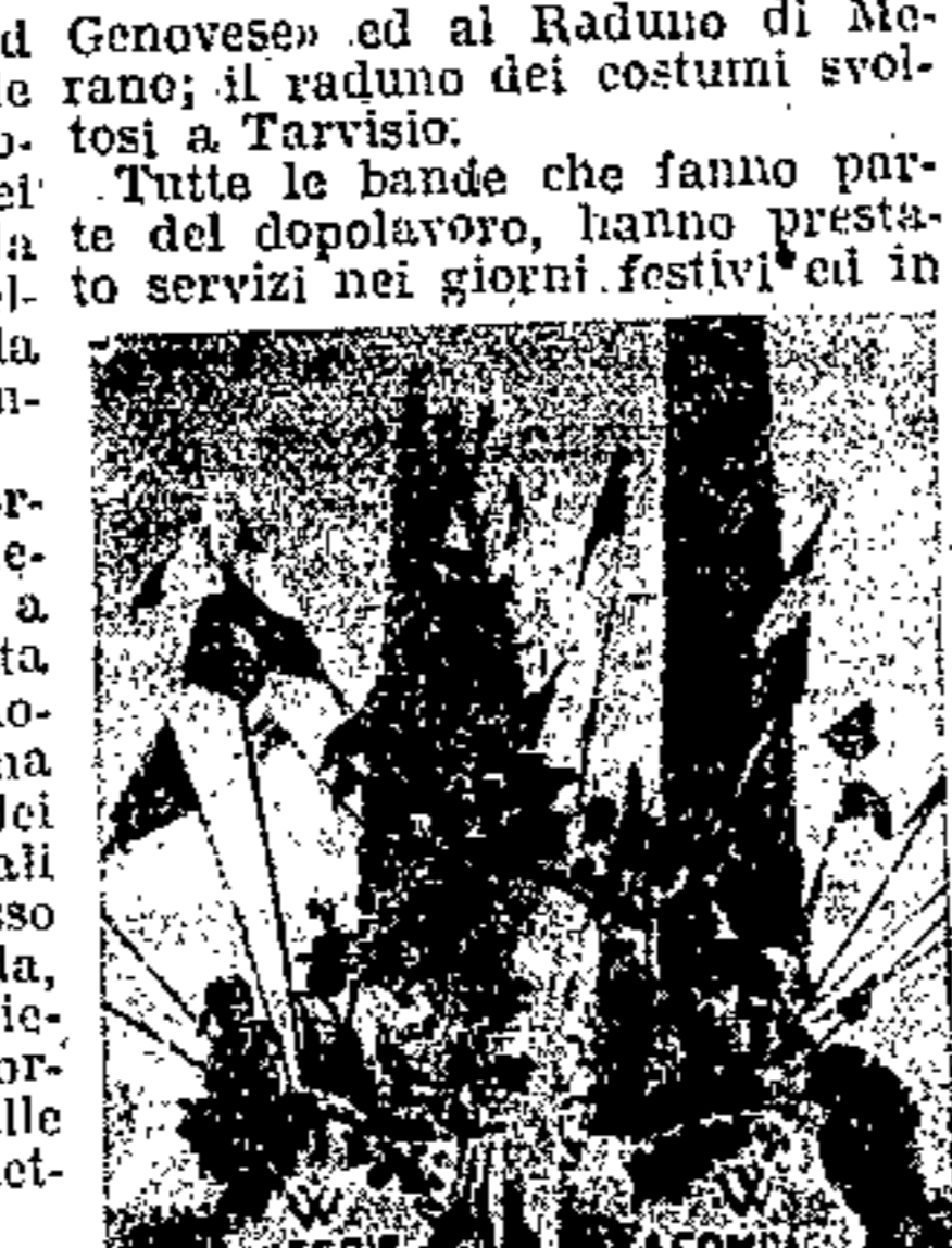
IV Festa dell'Uva - Carro del Dopolavoro di Montegnacco

Genovese ed al Raduno di Merano; il raduno dei costumi evoluti a Tarvisio. Tutte le bande che fanno parte del dopolavoro, hanno prestato servizi nei giorni festivi ed in occasione di ricorrenze nazionali e religiose.