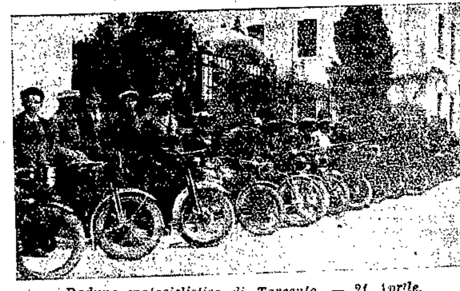
Raduno motociclistico di Tarcento - 21 Aprile

Manifestazioni agricole Due manifestazioni particolarmente riuscite segnarono il successo dell'Opera Nazionale Dopolavoro in questo campo: la giornata del gelso e la festa dell'Uva. La prima fu solennemente co-