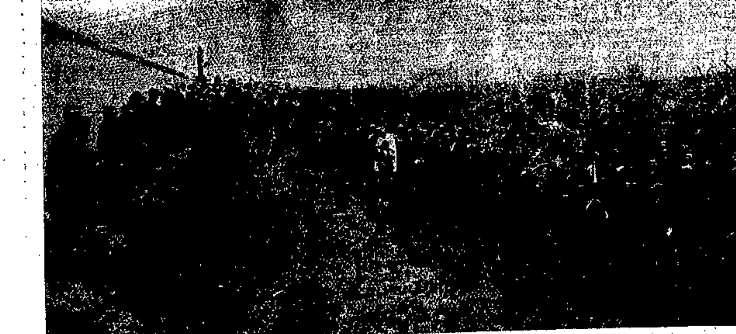
La piantagione dei gelsi fatta dal Dopolavoro di Palso di Percia

Questa attività, che tanta importanza ha per la ricreazione o l'educazione del popolo, è stata oggetto di particolare cura da parte del Dopolavoro Provinciale e delle sezioni dipendenti. La Federazione Filodrammatica ha raggiunto, come abbiamo visto, un totale di quasi cinquantatà gruppi che impegnano circa