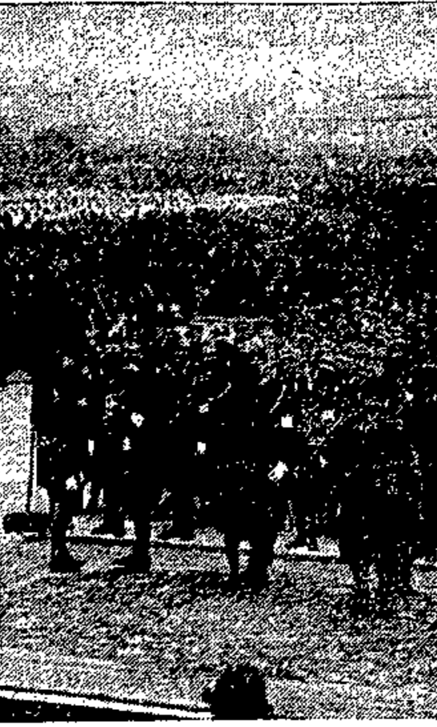
Odorico da Pordenone (1-A) dal Commissariato Nazionale dell'A.N.F.

Il superbo spettacolo di ordine, disciplina e compostezza offerto dai Ballilla incorporati nella 757.ª Legione Moschettieri « Fulcieri Paolucci di Calbott », non può esimerci dal rivolgere un vivo elogio ai miei collaboratori comandanti di ogni reparto ed al Ballilla tutto il plauso di S. E. Ricci, espres-