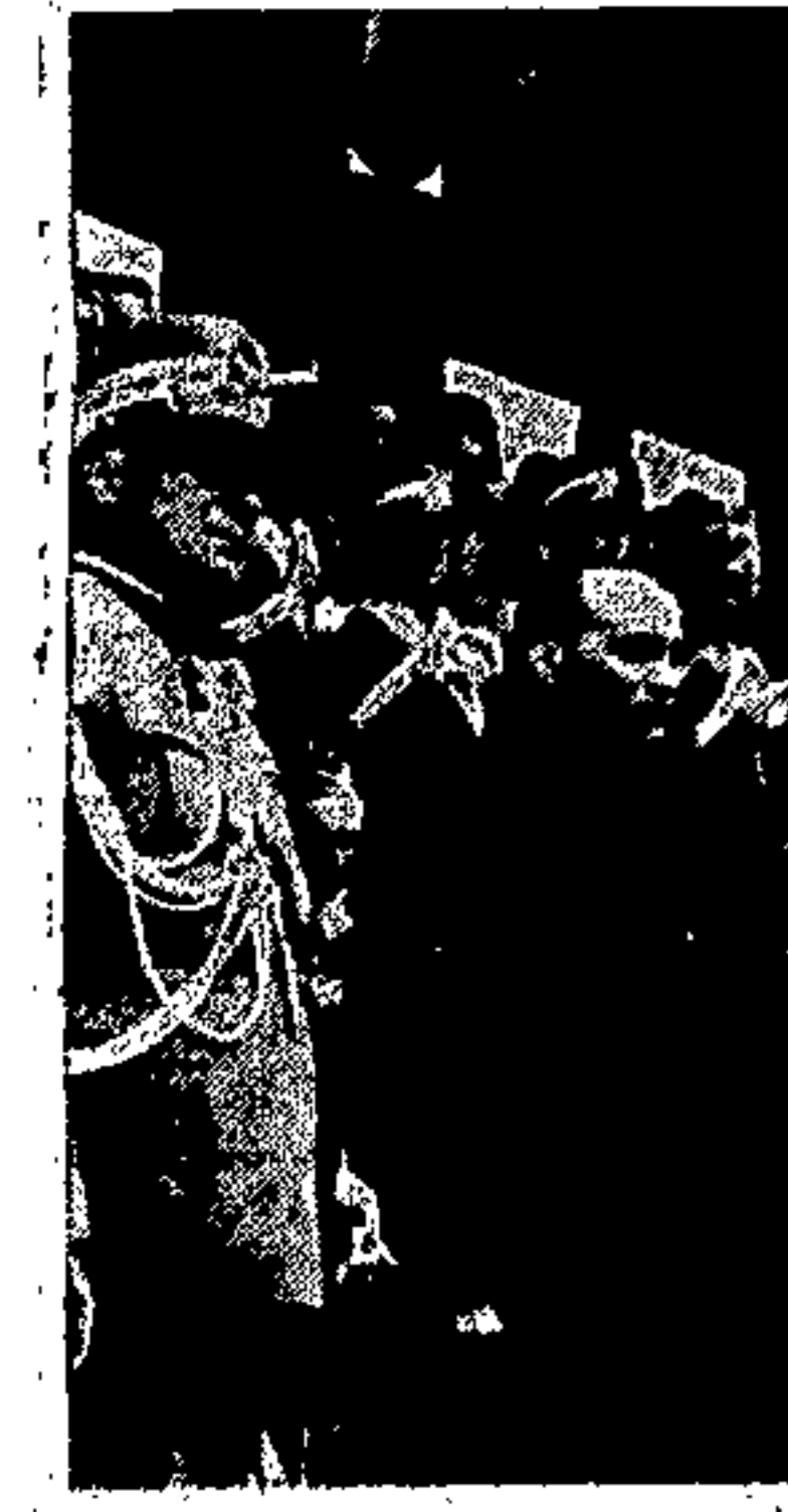
S. E. Renato Ricci, contornato dalle autorità, assiste al rito della VII Leva Fascista dalla tribuna di Camp. Moretti. — Il Segretario Federale Gli porge il saluto delle Camicie Nere del Friuli.

I ferotramviari friulani iscritti al Sindacato delle Comunicazioni interne e dipendenti della Società « Tramvie del Friuli » e della « Tramvia Udine - S. Daniele », consapevoli della benefica opera che il Regime va attuando con instancabile attività a favore delle classi lavoratrici con le sue istituzioni, hanno chiesto indivi-