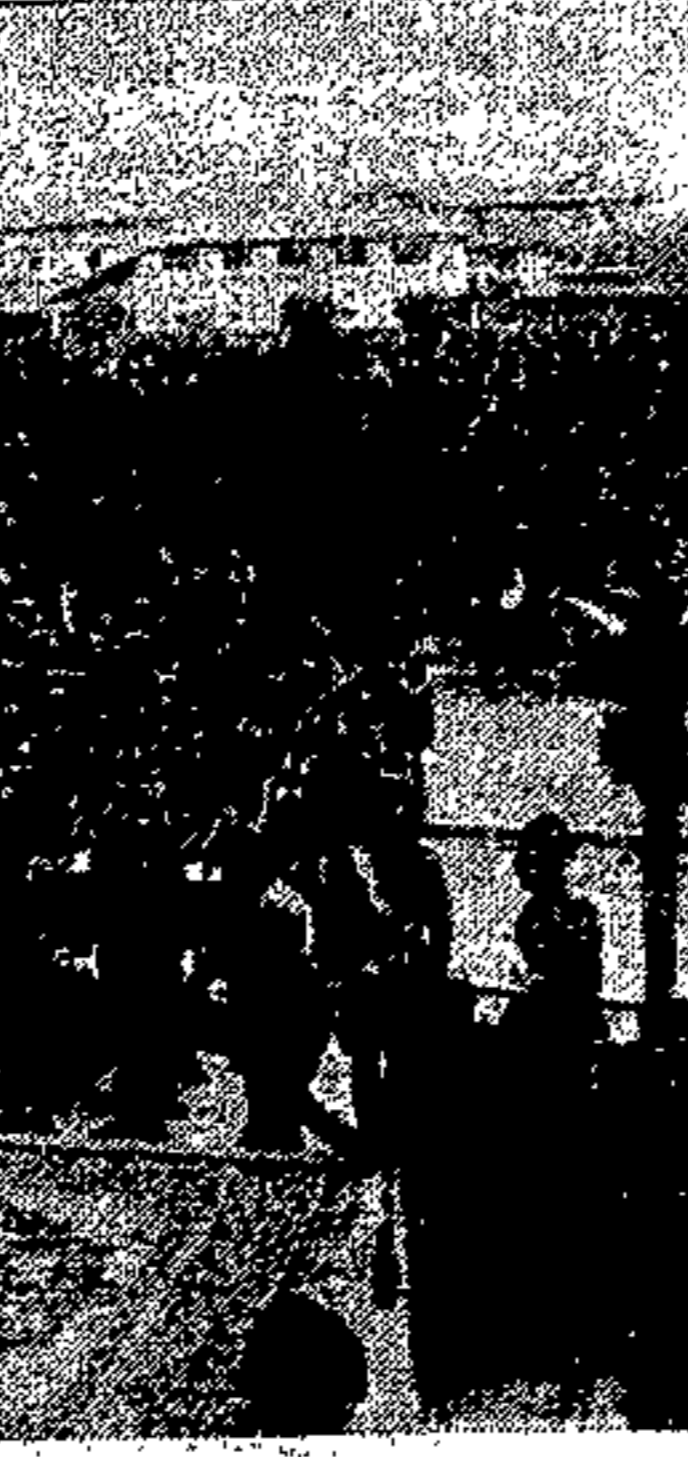
Adunata a Zompitta (località Minissin) per le ore 14 pom.

La Sezione di Udine dell'Associazione Nazionale del Fante, comunica: Come fu ieri pubblicato i Comandanti dipendenti sono tenuti a presenziare al gran rapporto che sarà tenuto questa sera alle ore 21 presso la Sede (via Beato