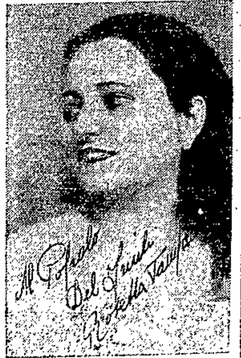
Soprano ROSETTA PAMPANINI in «Bohème» e «Fedora»

La seconda di «Bohème» Ieri sera si è avuto al Puccini la seconda rappresentazione di «Bohème» che ha rinnovato e superato il successo della recita precedente.