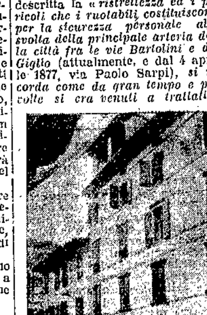
coi proprietari della casa da tagliarsi per allargare quella svolta, trattative che non ebbero effetto in causa delle eccessive esigenze del proprietario.

All'inizio del secondo tredicesimo Udine era ancora un semplice borgo o Terra, come allora si diceva. Il Patriarca Bertoldo, allo scopo di eccitare lo sviluppo e richiamarvi nuovi abitanti, fissò nel 1233 la propria residenza nel Castello e istituì il mercato settimanale del sabato concedendo, nel contempo, alcune esenzioni di tasse al Comune.