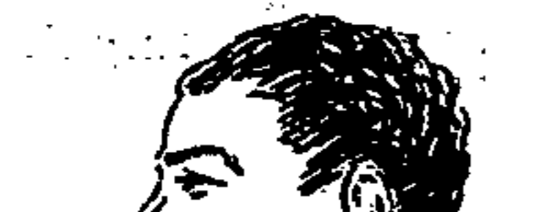
Felini che dopo un periodo grigio, sta riprendendo la sua forma migliore.

Udinese risponde e ottiene un corner senza esito. La superiorità dei bianchi è manifesta e il punto, maturato da un pezzo, giunge però in una forma molto machiana. Siamo al 23', i bianchi abbozzano una offensiva discesa, che giunge in area bianco-nera ove si forma una fitta miscela: un tiro, parlo da un monfalconese, batte contro un bianco-nero e finisce tranquillamente in rete. Punto banalissimo ma sufficiente per assicurare la vittoria alla squadra del Cantiere.