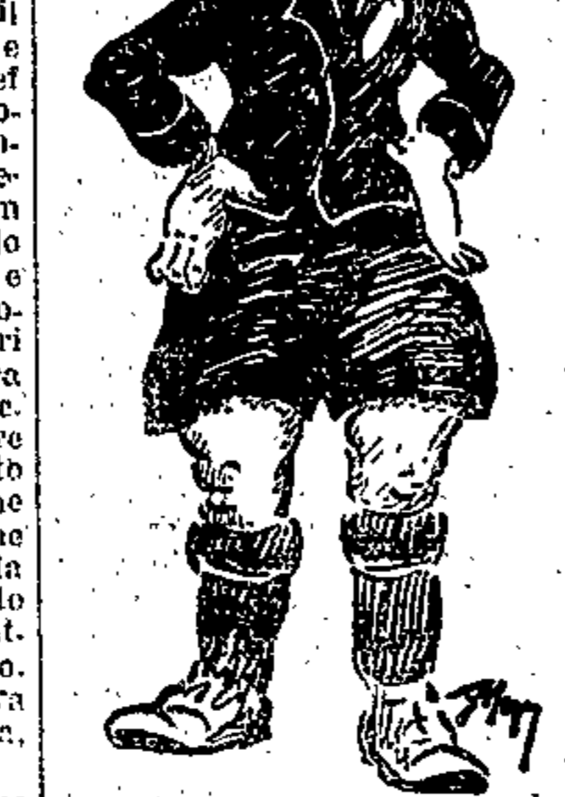
Il più bel ciuffo del G. A. U.