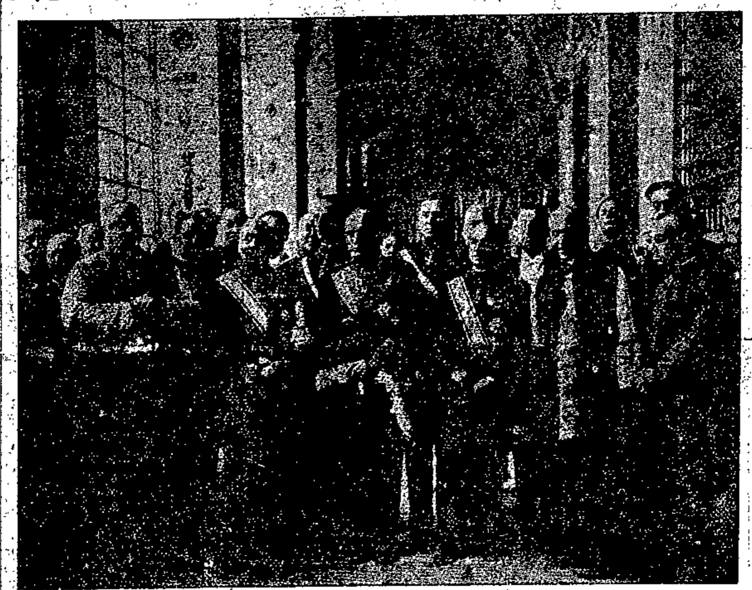
Mussolini e il seguito nelle Logge Vaticane