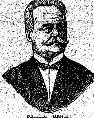
Edoardo Müller nuovo presidente della Svizzera.

Ultimamente venne eletto a nuovo presidente della Confederazione Svizzera, il dott. Müller di cui vi diamo il ritratto.