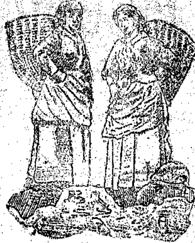
Donne di Zuglio.

del Cortadla; a nord il Tacchia dietro cui spunta il Coglians; ad ovest il gruppo