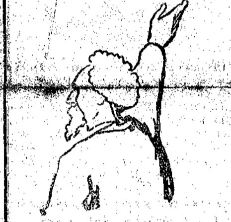
Vera effigie del divo Ferrri tolta dall'Avanti, osservando l'atteggiamento di quei signori congressisti.

I lavoratori ascoltano e non capiscono; ma, ogni tanto, scossi da qualche parola più chiara e percettibile, abbandonano il