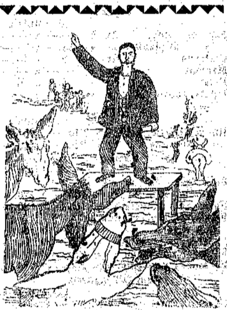
Fotografia istantanea di una conferenza socialista a Ronchis di Latisana.

Alla famiglia inviamo le più vive e sentite condoglianze.