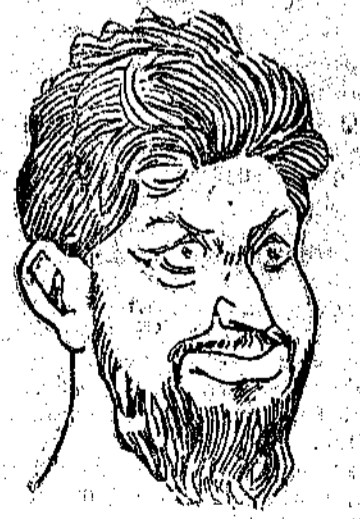
Vera effigie di Turati tolta dall'Avanti.

Avete capito? I mezzi litri si succedono