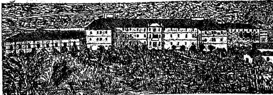
Seminario di Cividale.

Tutta questa settimana scorsa Cividale fu in festa, chiudendole colla festa federale di questa domenica. Sono le feste del XI o centenario di S. Paolino. pure questa Domenica alla sera. L'illuminazione fantastica della città venne fissata per la sera di sabato 25 Agosto. Onorarono di loro presenza, taluno