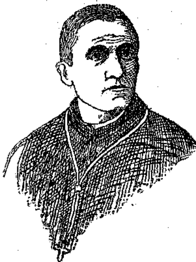
S. E. Mons. LUIGI PELLIZZO Vescovo di Padova

La Festa Federale deve riuscire come l'anno scorso imponente e grandiosa.