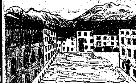
Piazza XX settembre

Nè mancano a Tolmezzo gli istituti di beneficenza, di economia e d'istruzione quali l'ospitale, la casa di ricovero, la società operata di mutuo soccorso, due banche, una eccellente scuola d'arte ap-