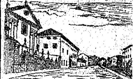
Collegio Salesiani — Via 24 Luglio

Ma quando i comuni presero a svolgersi anche nella nostra patria, quello di