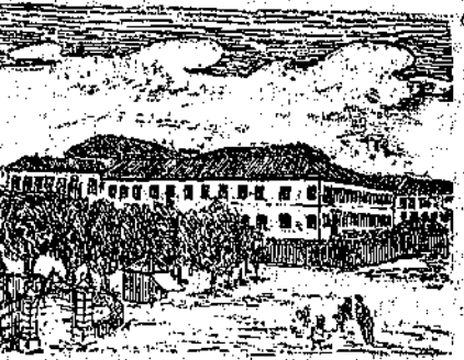
Piazza XX settembre e Tribunale

freschi antichi ben conservati; il palazzo Gregoris per lo stile grandioso; ed il palazzo del Comune (la vecchia loggia) il cui corpo di mezzo fu disegnato da Pomponio Amalteo ed eseguito da un maestro Giacomo da Gemona allo scorcio della prima metà del secolo XVI. Questo