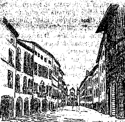
Corso Vittorio Emanuele

Attualmente Pordenone per le sue industrie è divenuta il centro più impor-