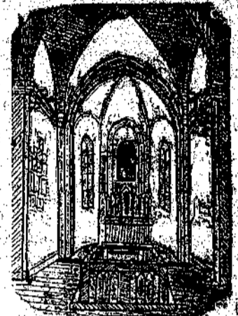
La Cappella dei Santi Martiri.

Il Preside, indignato, li fece sospendere ad un eculeo e tormentare ancora