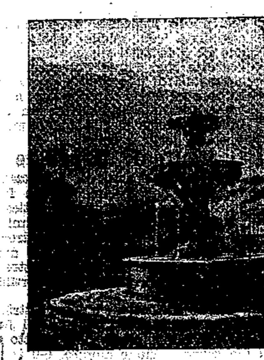
ALESSANDRO DEL TORSO «Serenità», Sala H, N. 138

Si seguono le linee delle vallate vicine, si pensa alle più lontane, coordinando le alle linee dei monti si contempera ed ammira l'elevarsi del collo a piccole macchie d'alberi e di casugli ed a spazzati prati resi con evidenza consociata ad un profumo di poesia; e dalla carezza di fianco e dalla donna che si allontana col secchio ricolori e dal gruppo di ragazzetti giocherellanti ai margini della molle prateria s'indovina il villaggio vicino. Ed un senso di nostalgia ci prende. Oh, vivere assai, in quella pace, in quella serenità!