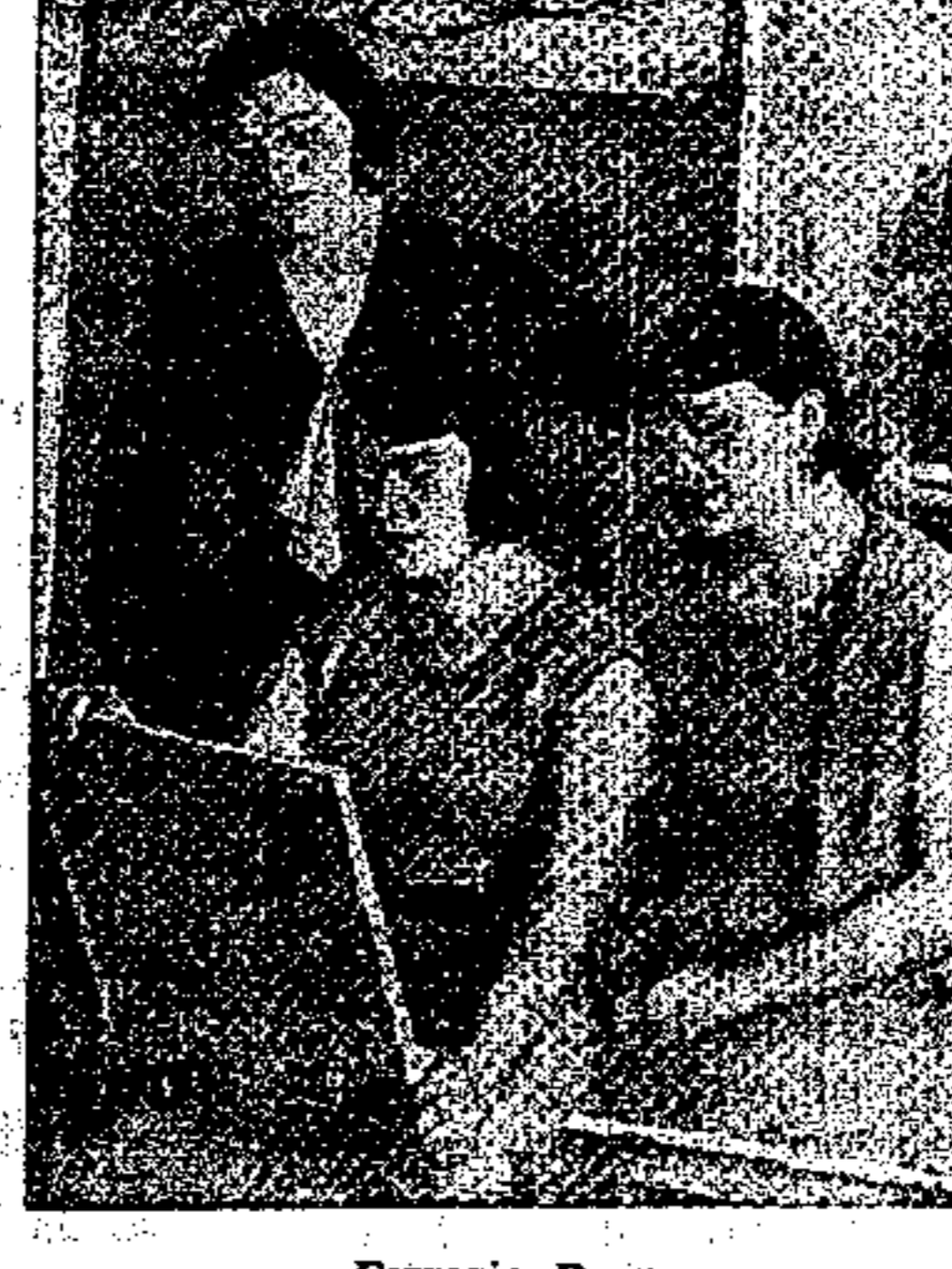
Ferrario Bruno «NELLO STUDIO» (Sala A, N. 15)

Presento qui la riproduzione di «Nello studio». Sono tre giovani donne che stanno guardando un quadro — tre sorelle, a giudicare dai lineamenti; ma tre volti distinti per espressione. Due sedute, una dietro di loro, in piedi. Guardano intente il lavoro — forse, un ritratto di persona cara, forse un paesaggio dipinto dalla giovane che lo tiene fra le mani e ne pare discretamente soddisfatta, mentre quella seduta a sinistra di lei forse ne cerca qualche difetto e la ferma, in piedi, lo fissa attentamente. Ne risulta un insieme di figure vive, che si staccano dal sobrio fondo e suscitano subito la simpatia di chi la contempla soddisfatto.