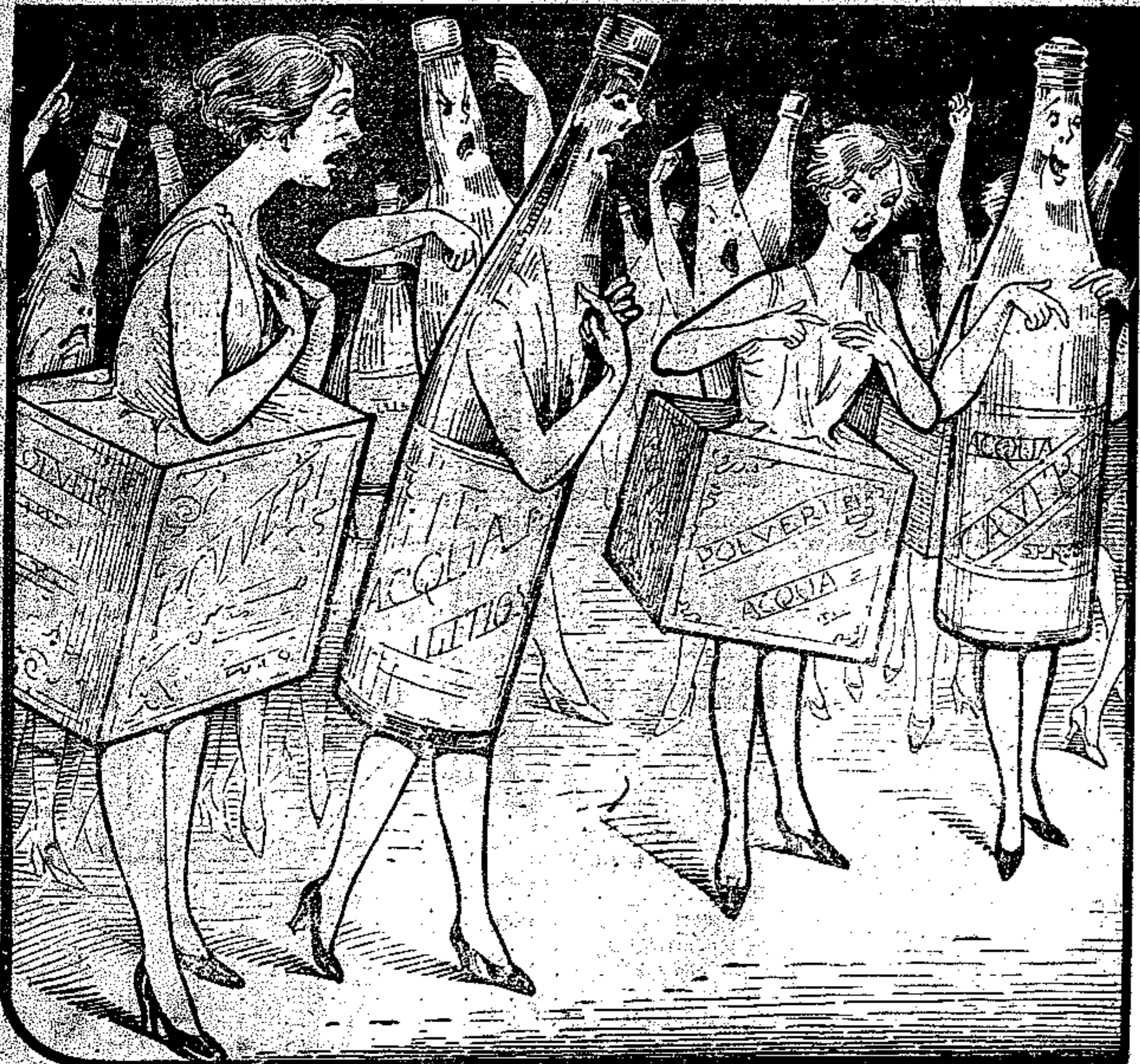
-- NOI PURE (STRILLANO QUELLE SDEGNOSE) SIAMO ECONOMICHE GRATE LITIOSE!