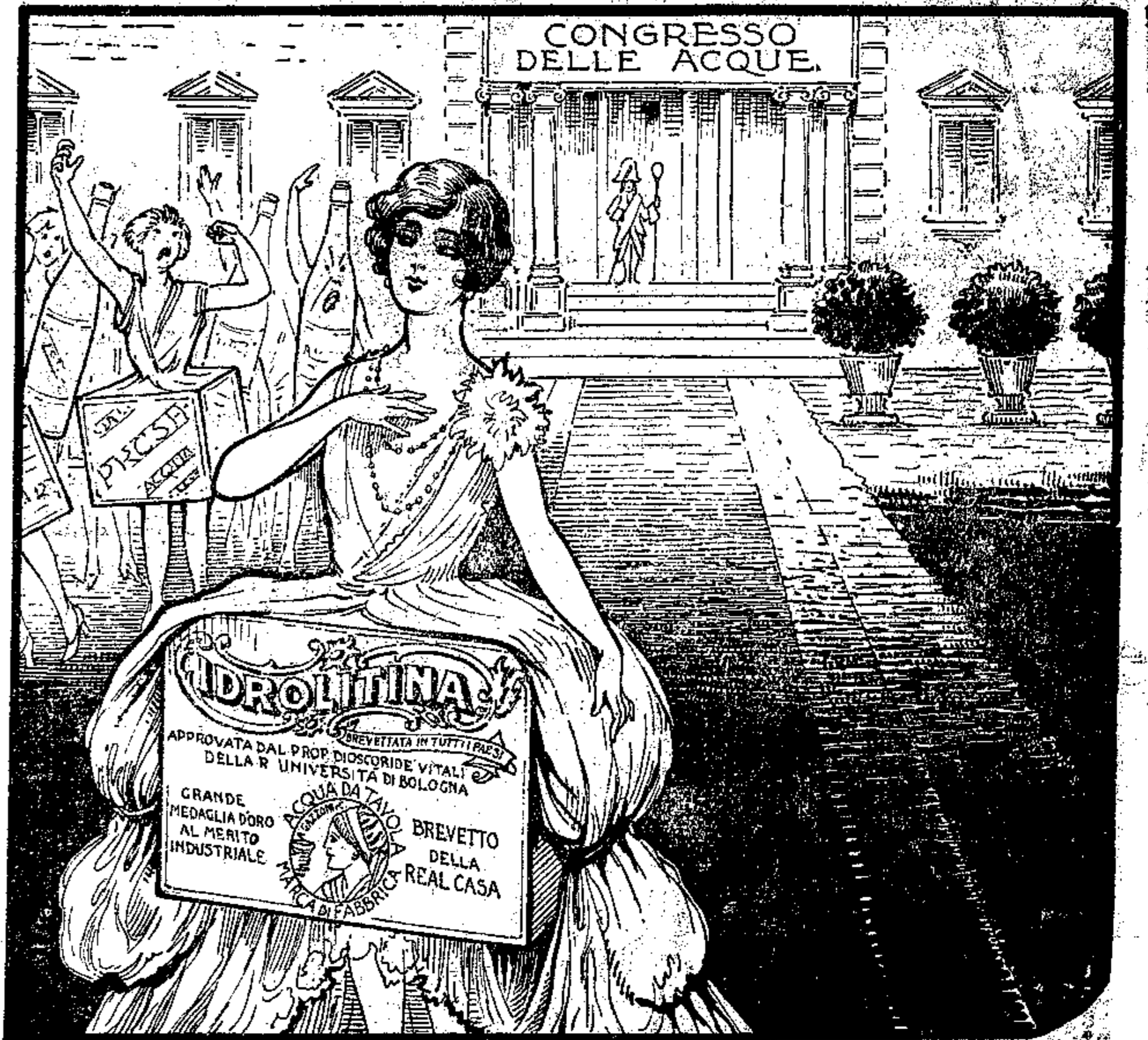
-- SI' (L'ALTRA REPLICA, SENZA RANCORE) MA TUTTI DICONO: "E' LA MIGLIORE!"