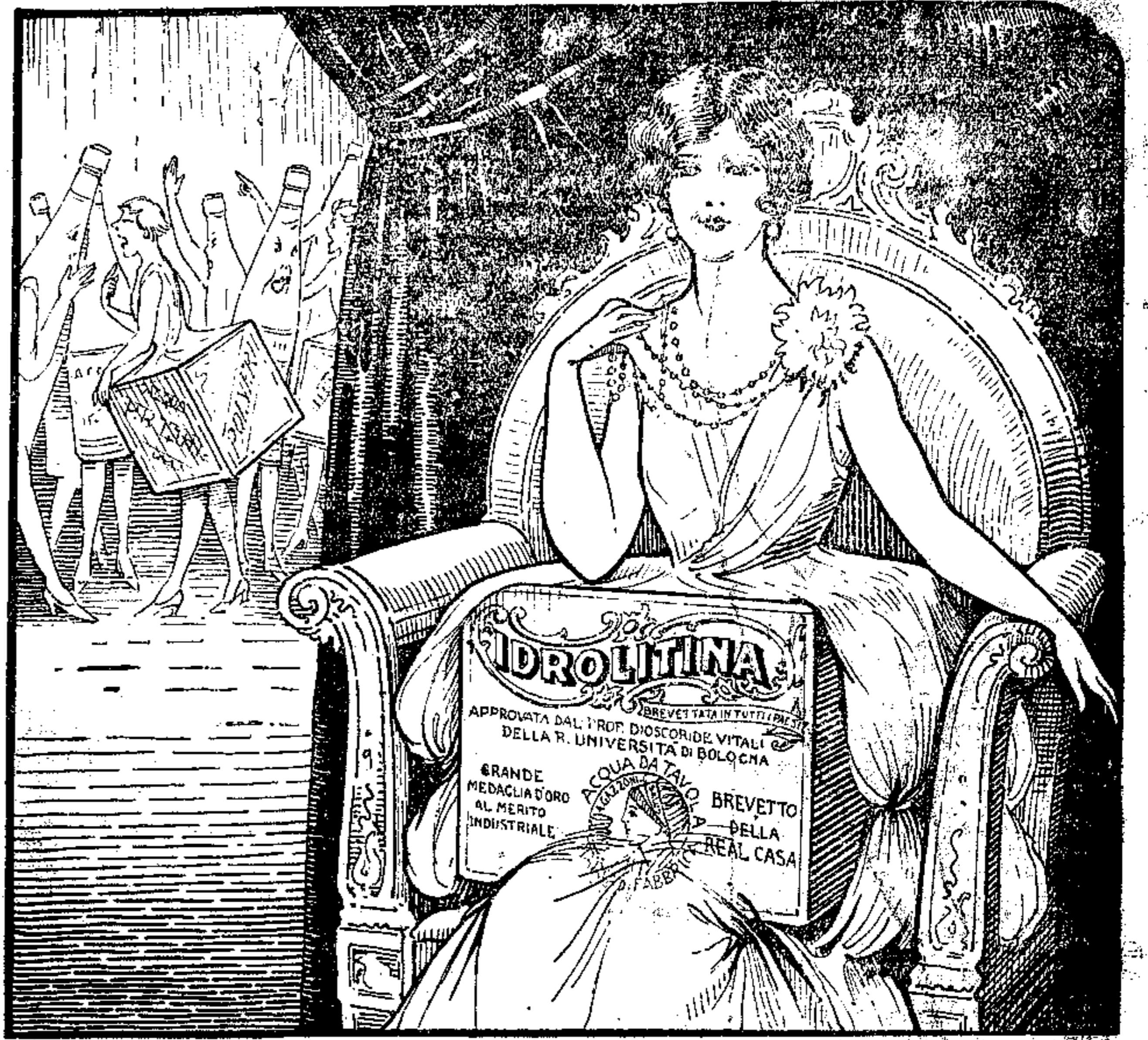
SOLA, IN DISPARTE, L'IDROLITINA SORRIDE, E TACITA SIEDE, REGINA.