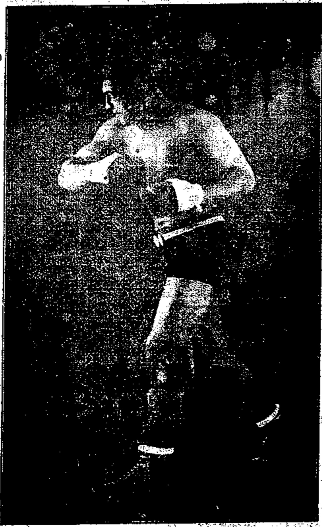
PRIMO CARNERA CHE SI E' SIBIRA' AL CAMPO POLI-SPORTIVO MORETTI DI UDINE ALLE ORE 15.30 DEL 4 NOVEMBRE

Sulla porta di casa ci congediamo affine dal grande pugiliatore, dal padre e dallo zio che ne siamo certi, ci hanno fin troppo sopportati.