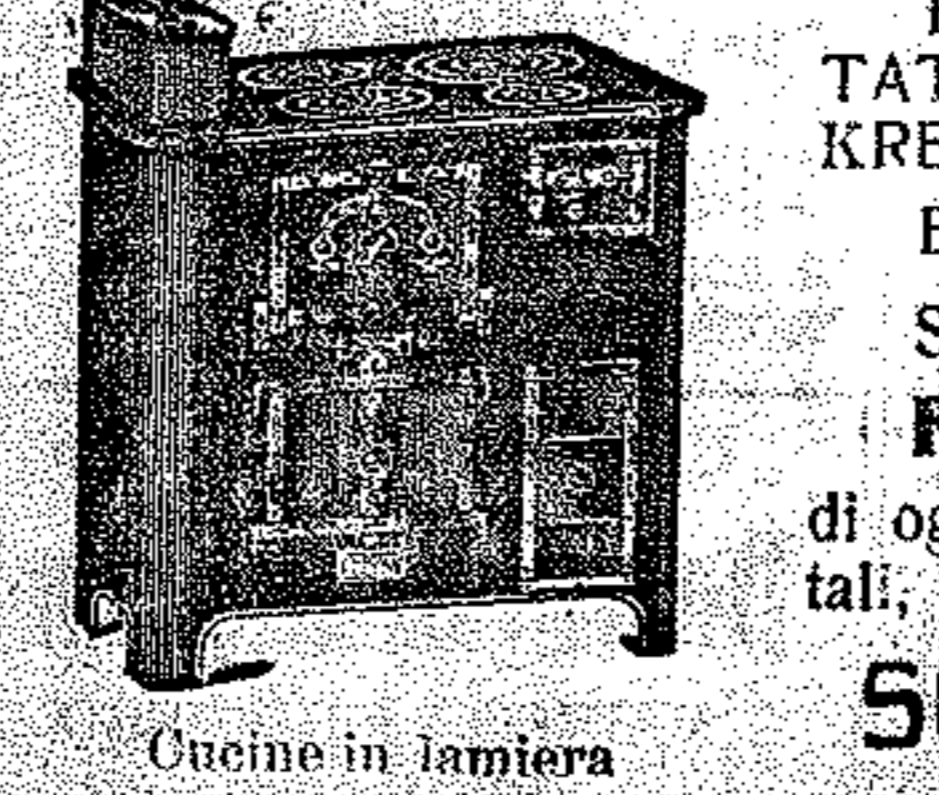
Cucine in lamiera