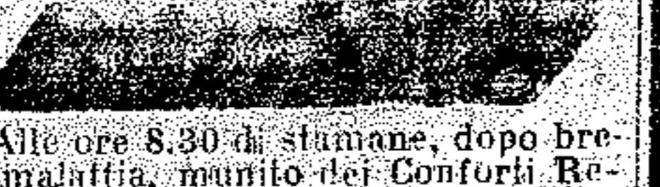
Alle ore 8.30 di stamane, dopo breve malattia, muore dei Conforti Religiosi, cessata di vivere.

23. — Mentre il vecchio progetto di costruzione della sede tramviaria Triestino-Taronto è in via di esecuzione, nei si sarebbe dovuto trarre profitto dall'occasione per risolvere la necessità della sistemazione razionale di quei duali di vicoli e vicioletti che formano il Borgo d'Amore.