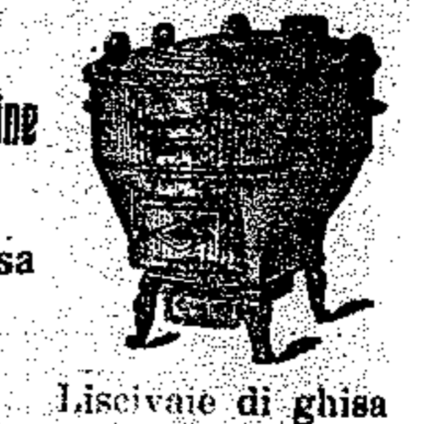
Liscivate di ghisa