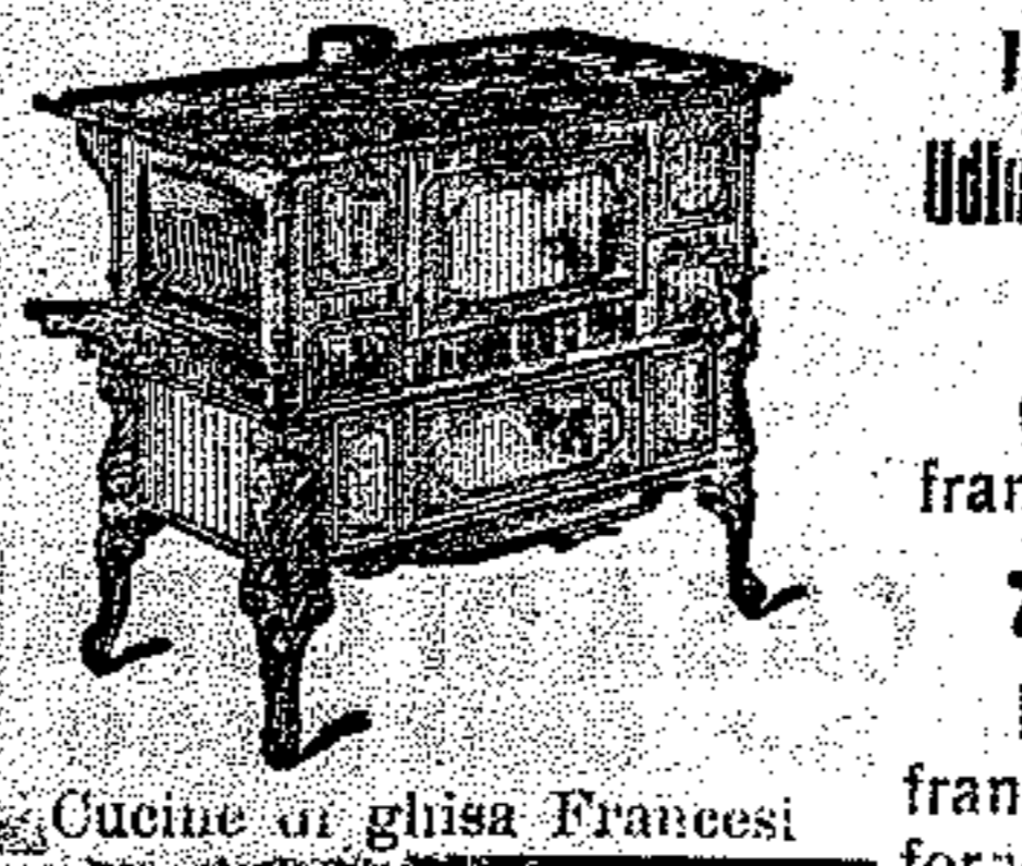
Cucine di ghisa Francesi

Tutte le lavandaie che hanno interesse a conservarsi la clientela, dovrebbero usare soltanto il SAPONE ADRIA.