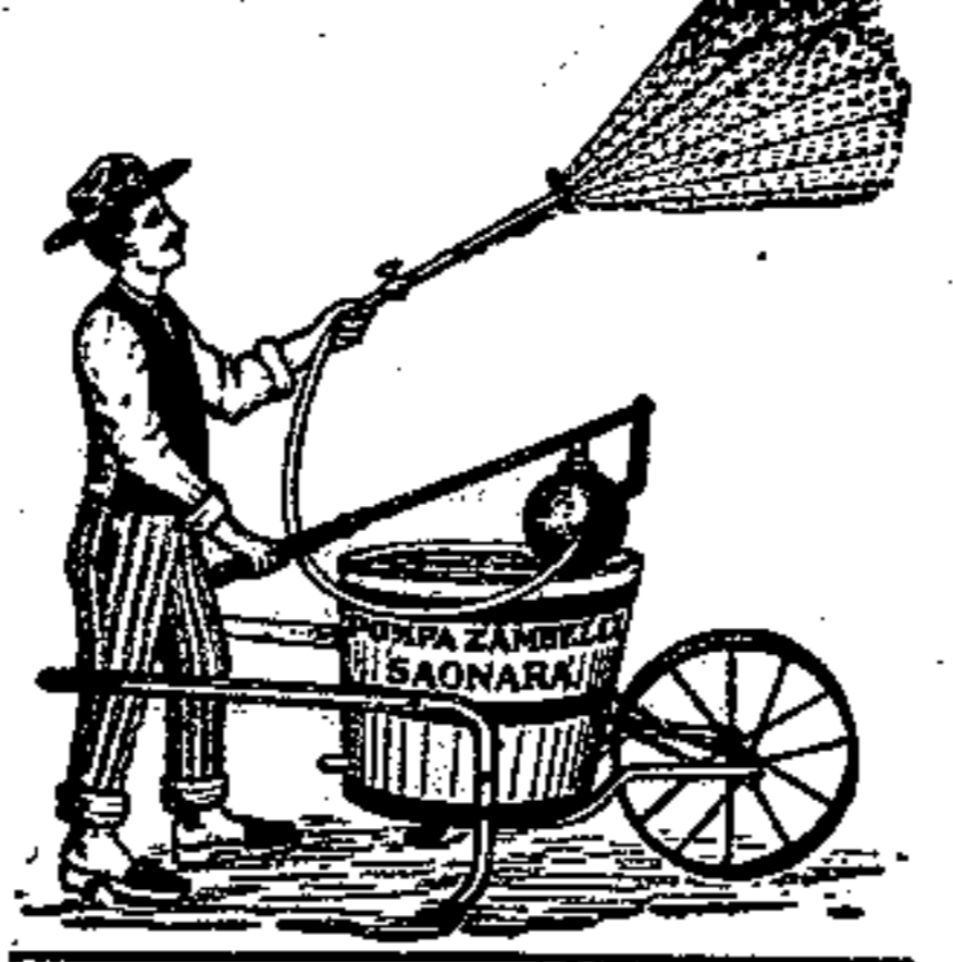
La pompa irroratrice originale Zambelli, Saonara s'impone sopra qualunque copia del genere.

32 anni di prova Cataloghi gratis a richiesta